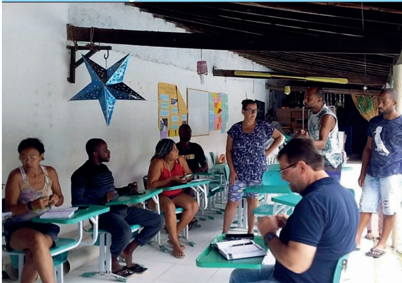
Existem cerca de 1 mil trabalhadores do setor em toda a cidade