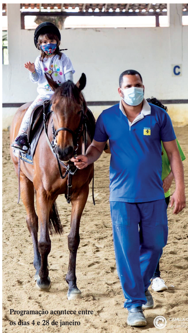
Programação acontece entre os dias 4 e 28 de janeiro