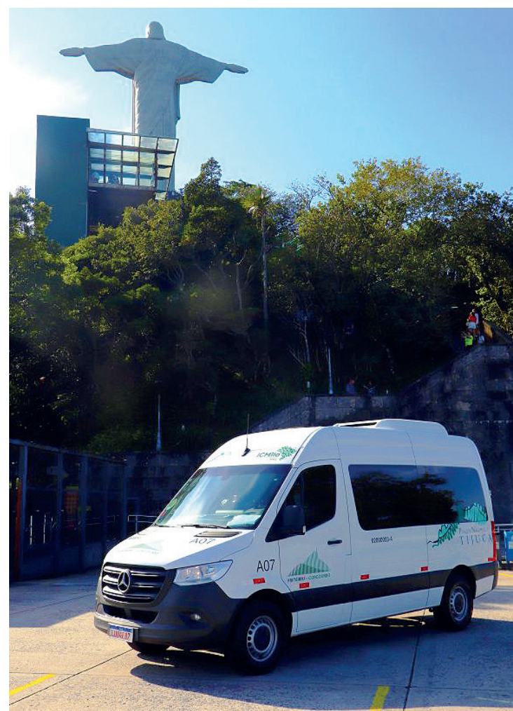
Vans oficiais de Paineiras Corcovado circulam em horário reduzido nos dias 31 de dezembro e 1º de janeiro. O AquaRio e BioParque do Rio também funcionarão em horário especial

Com uma programação de shows imperdíveis, o projeto Palco Caxias Shopping transforma a praça de alimentação do empreendimento em um ponto de encontro para os clientes aproveitarem o happy hour, com muita descontração e ótima gastronomia, ao som de uma boa música ao vivo.