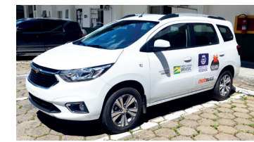
Veículo do modelo Spin, da Chevrolet