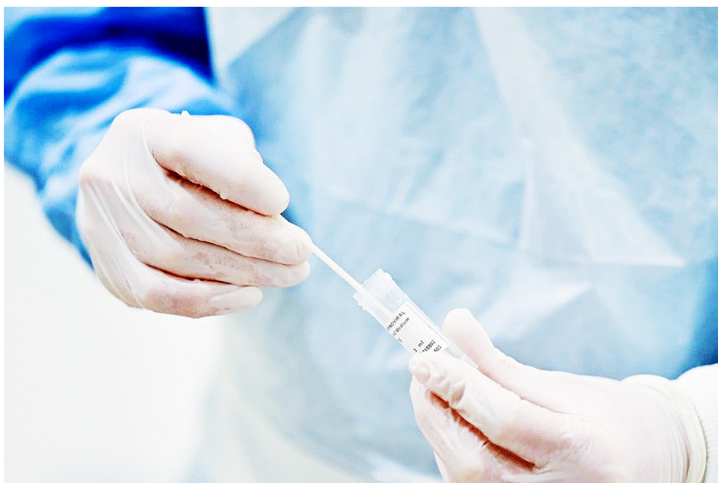
Este teste é o 22º que o grupo lança desde o início da pandemia

O grupo suíço Roche anunciou que vai lançar no mercado um novo teste para diferenciar o coronavírus da gripe A e B, que apresentará resultado em 15 ou 30 minutos.