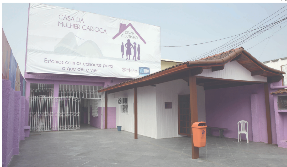
Este projeto é realizado em parceria com o Ministério da Mulher, da Família e dos Direitos Humanos e a Aliança Empreendedora

As mulheres sem acesso a computadores ou à internet poderão utilizar os equipamentos das Casas da Mulher Carioca nas quartas e sextas-feiras para fazer a inscrição e participar das aulas. As inscrições terminam no dia 31 de dezembro. Para se inscrever, basta acessar o link https://evento.aliancaempreendedora.org.br/snpm-landing-page