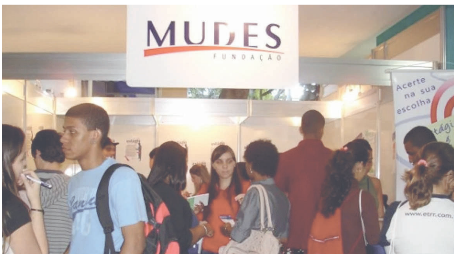
O valor da bolsa-auxílio pode chegar a R$ 2 mil

Rua Limites, 1349 - Realengo Tel. 3464-18 E-mail.: casadamulher-dinahcouthino@gmail.com