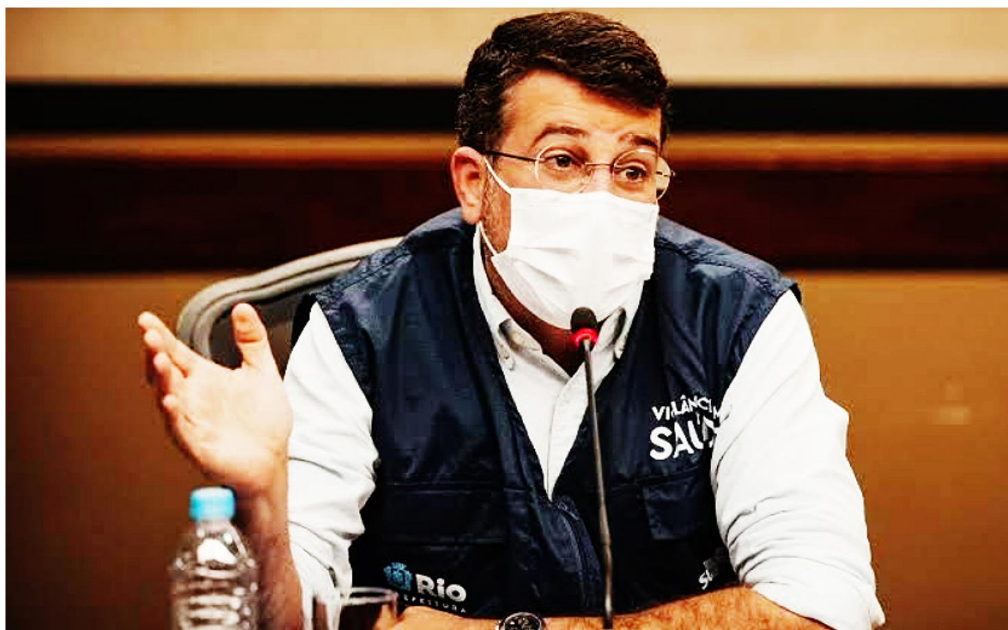
Secretário afirmou que a confirmação de casos da nova variante Ômicron no estado é motivo de insegurança

De acordo com Soranz, apesar do cenário epidemiológico da cidade ser positivo, com alta cobertura vacinal e queda no número de internações pela doença, a confirmação de casos da nova variante Ômicron no estado é motivo de insegurança. O secretário comentou, ainda, sobre a fala do governador Cláudio Castro de que a decisão sobre a festa ainda seria tomada. Segundo