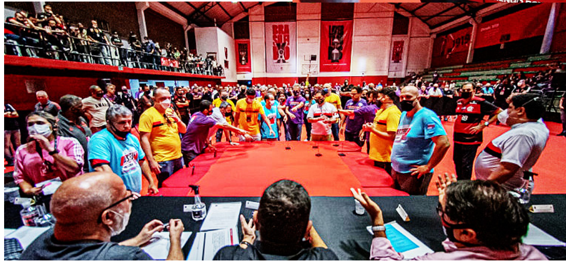
A Chapa Roxa de Landim não conseguiu os 80% necessários para preencher todas as 60 vagas do Conselho de Administração