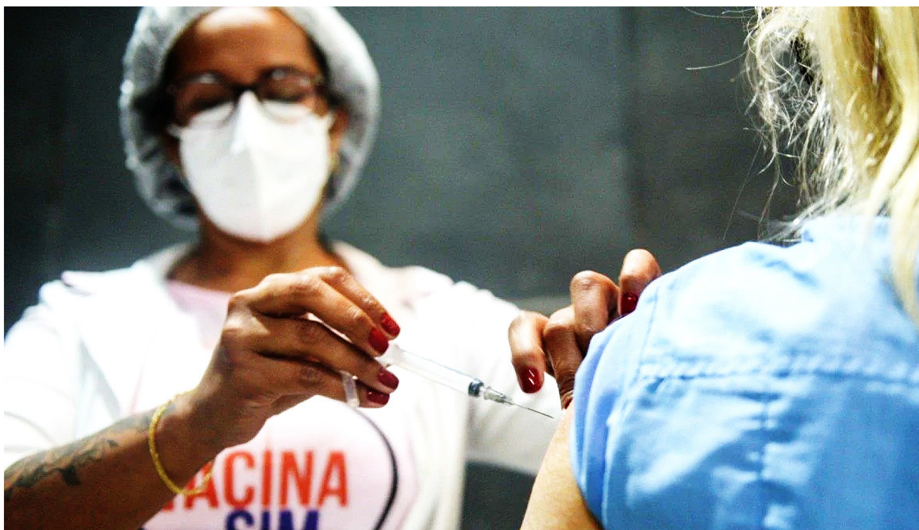
O número de cariocas que receberam a primeira dose ultrapassa os 5,8 milhões

No Rio, até o momento, há 143.559 pessoas vacinadas com a dose única. O número representa 87,7% da população total carioca. Em relação à dose de reforço, 1.156.683 cariocas receberam a terceira dose no município. No total, 12.216.438 foram aplicadas no Rio.