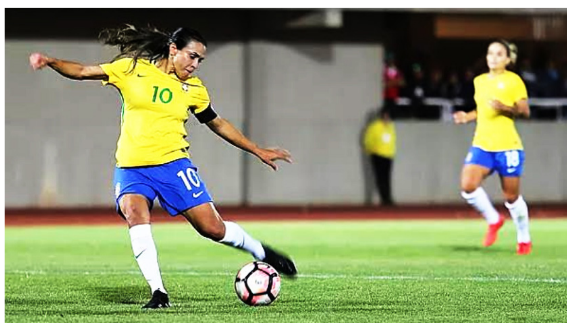
Edição 2021 da competição “Mano a Mano - Donas do Jogo” chama atenção para a presença feminina nos esportes

“É muito mais do que uma competição de futebol com gran-