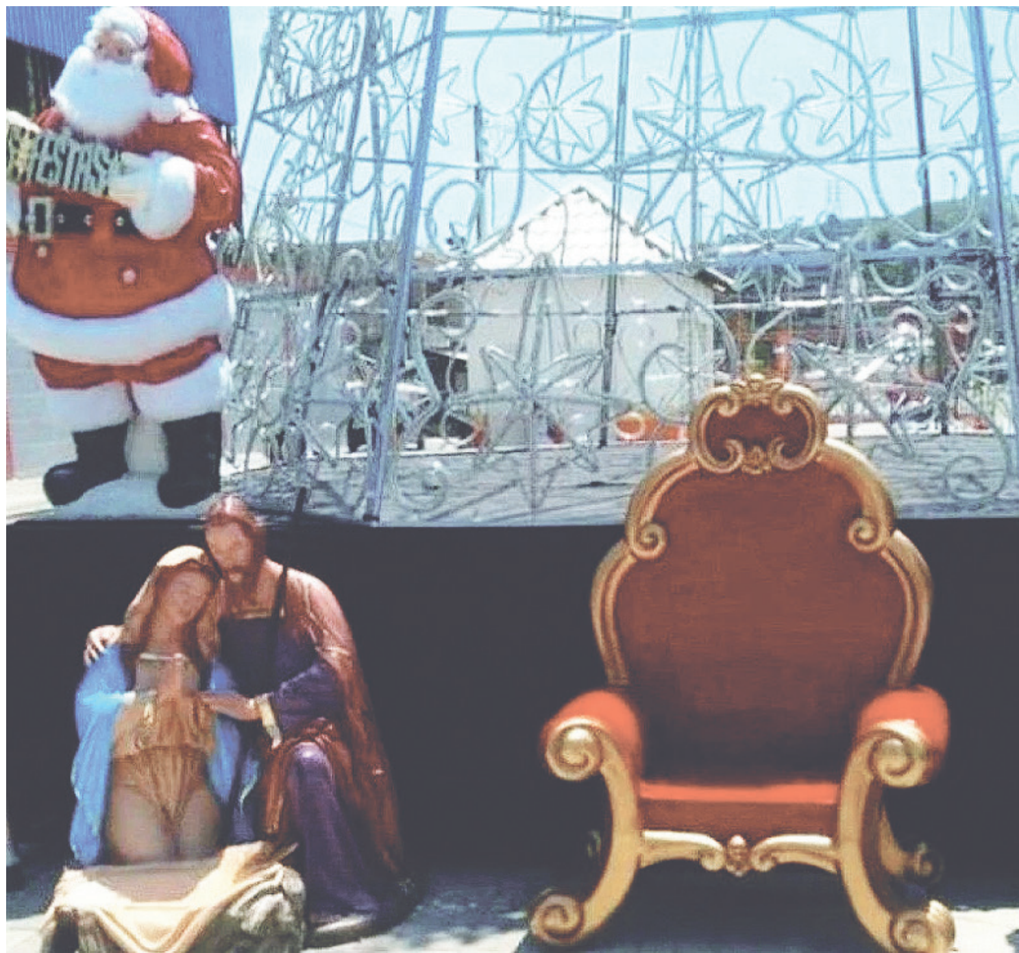
A repercussão fez com que o larário devolvesse a imagem

ram depoimento. A delegacia aguarda o laudo do exame de corpo de delito.