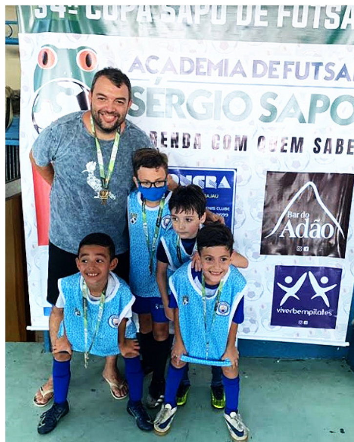
O Manchester City foi o campeão do sub-9