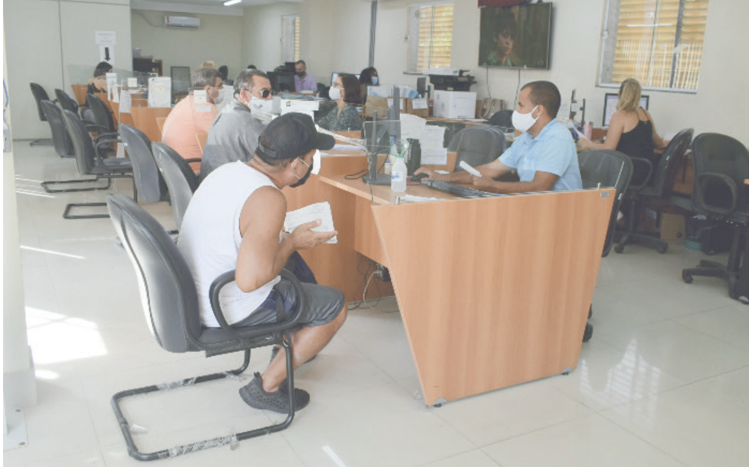
Pagamento efetuado antes do fim do ano fiscal evita encargos de dívida ativa ao contribuinte

“É importante esclarecer sobre o vencimento das guias de pagamento em cota única