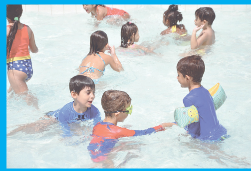
Colônia de férias do Mackenzie vem aí! CULTURA, P9