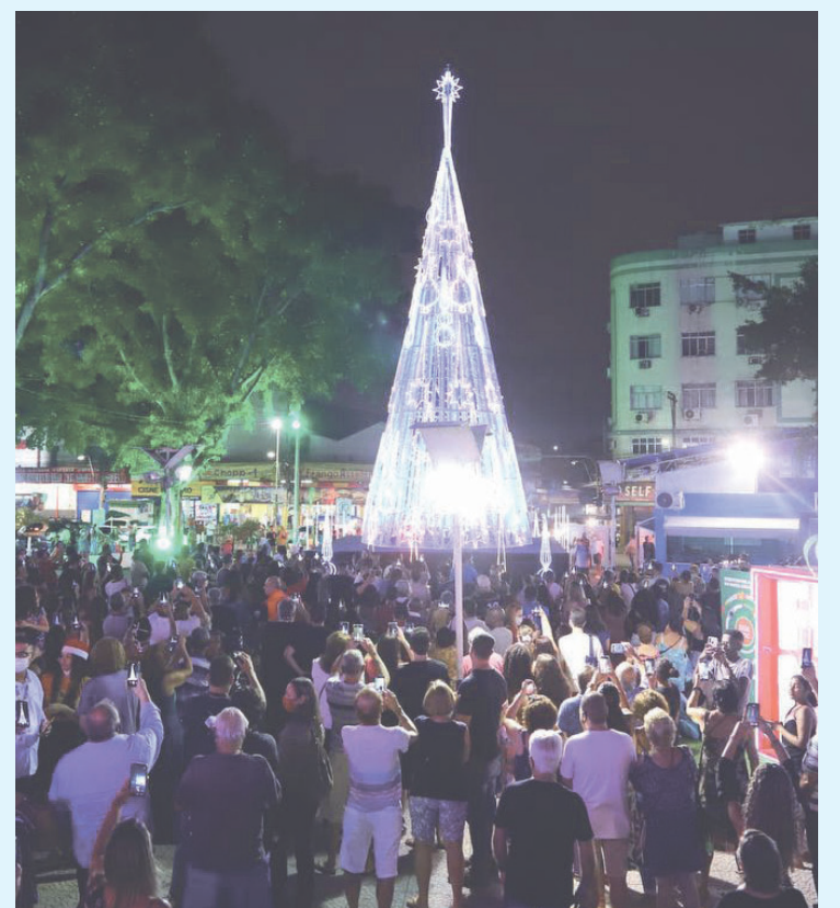
A árvore tem 16 metros de altura e está na Praça da Matriz

Segundo o SESC RJ, o objetivo é levar esperança à população com o período de pandemia que o mundo vivencia. O município foi contemplado pelo Serviço Social do Comércio (SESC RJ) junto com outras nove cidades: Rio de Janeiro, Cabo Frio, Miguel Pereira, Nova Friburgo, Petrópolis, Rio das Ostras, Teresópolis, Três Rios e Guapimirim.