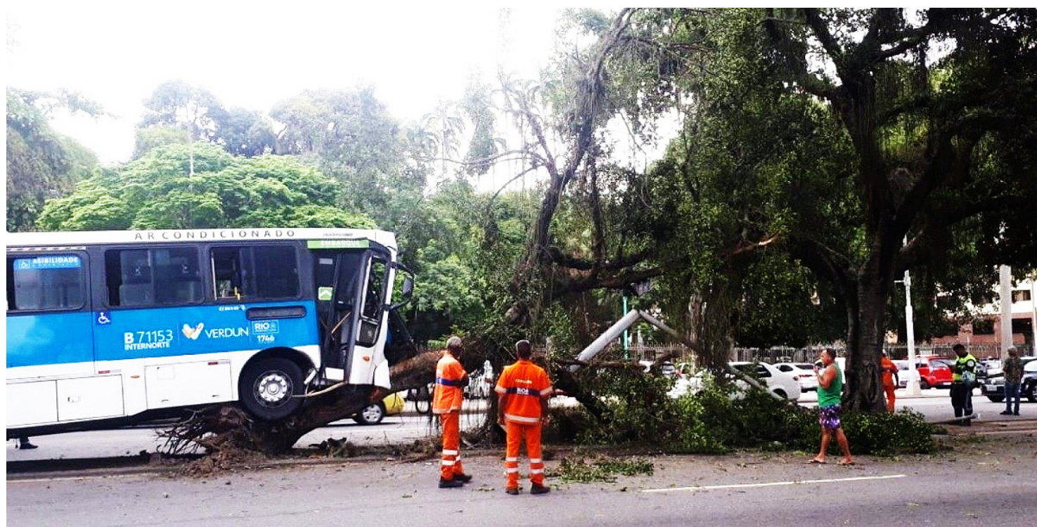
Segundo o Corpo de Bombeiros, o quartel da região foi acionado às 14h18

Para o secretário, é importante que o governo federal reavalie a cobrança do passaporte vacinal para todas as pessoas que venham ao Brasil, em aeroportos e vias terrestres. No Rio de Janeiro, segundo ele, a medida tem sido adotada em reservas de hotéis e aplicativos de hospedagem para reduzir a entrada de turistas não vacinados.