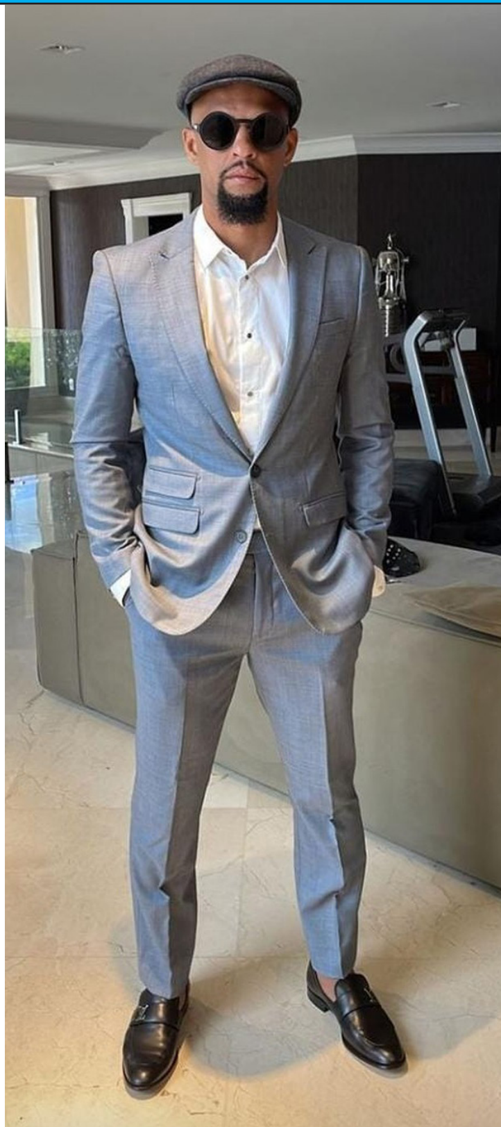
O volante de 38 anos será o primeiro reforço para 2022 do Tricolor