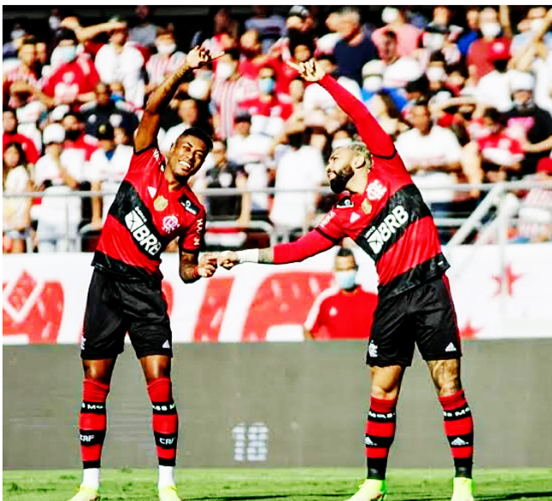
Partida acontece neste sábado, às 17h, no Centenário

Não é, também, uma informação. Apenas uma impressão. Mayke será o lateral-direito pela velocidade que possui para marcar Bruno Henrique, ou Michael, Felipe Melo pode aparecer como um