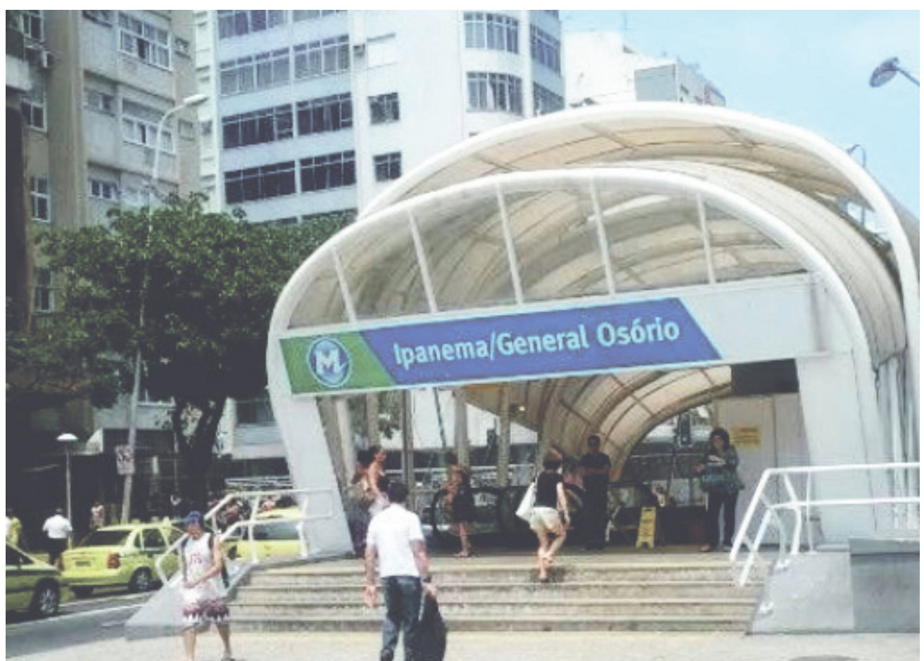
Volume chegou a R$ 2 milhões na ampliação da estação General Osório

"Certamente houve um superfaturamento na execução do contrato, que poderia ter sido evitado se a comissão de fiscalização tivesse se atentado para os parâmetros estabelecidos no contrato, mas infelizmente não foi o que ocorreu", disse o secretário.