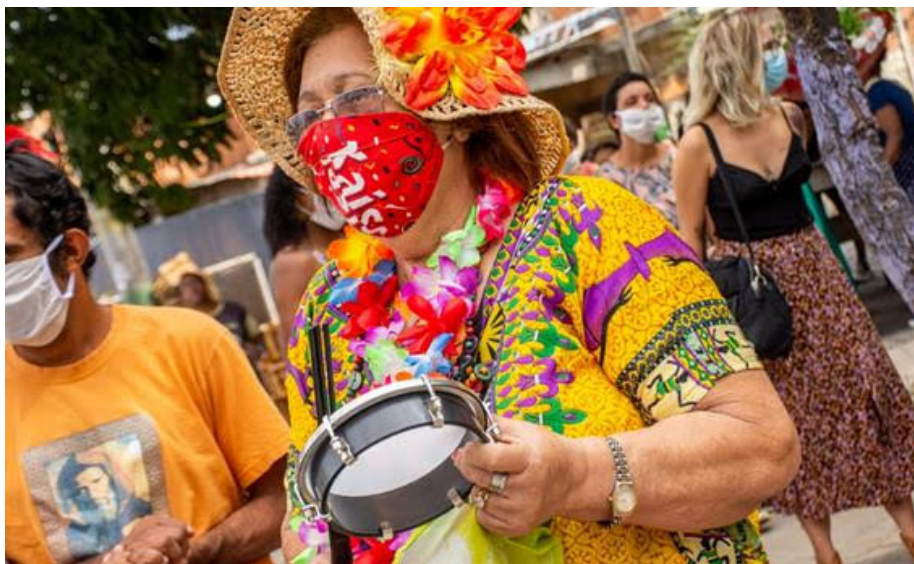
Iniciativa promove cursos, intervenções culturais, arte e gastronomia aos moradores do entorno

Entre os dias 03 a 12 de dezembro, pontos de BRTs, ruas, praças e estabelecimentos gastronômicos da Zona Oeste darão lugar a iniciativas culturais promovidas pelo Festival Ilumina Zona Oeste, atração que chega a sua 5ª edição buscando dar visibilidade aos artistas da região, com intensa programação cultural gratuita espalhada por toda Zona Oeste. A programação completa pode ser conferida no site www.iluminazonaoeste.org.br