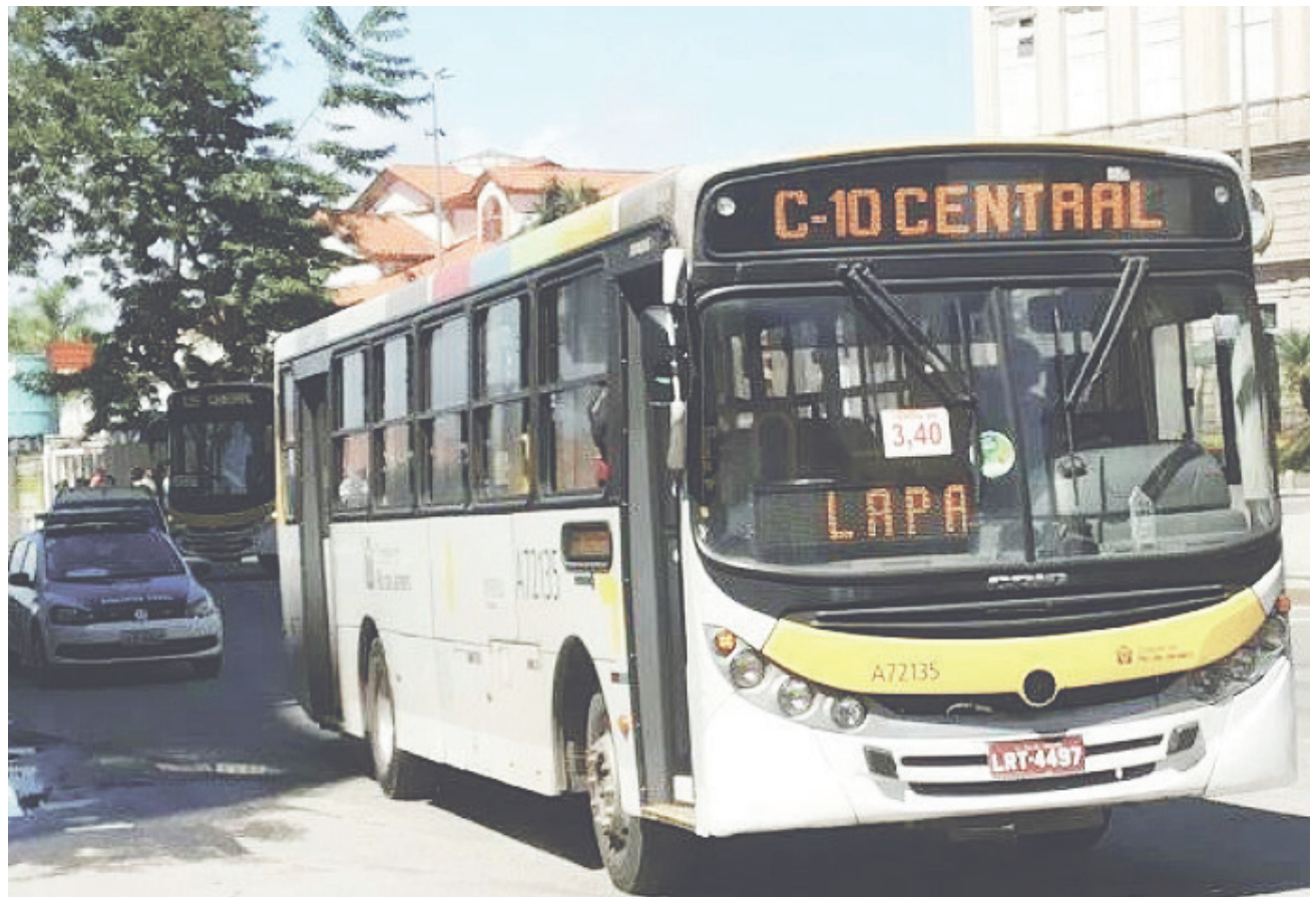
Linha teria deixado de circular há mais de um ano

O protesto conta com o apoio da AMA Riachuelo, AMAC-Centro, Banda do Bairro de Fátima, Bloco Dragões da Riachuelo, Banda da Amizade e Grupo Participação Bairro de Fátima, além das páginas no Facebook "Centro Lapa Residencial" e "O Morador é o Centro".