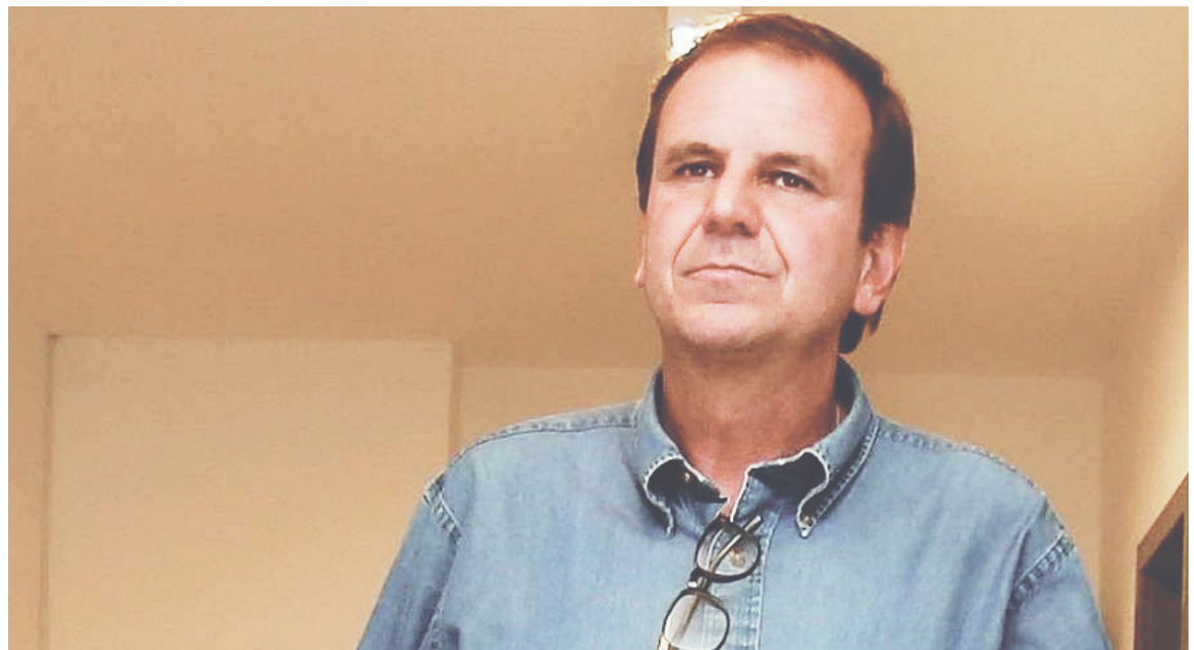
Categoria cobra do prefeito promessas de campanha

Em meio a esse protesto, ao meio-dia, serão distribuídas quentinhas com a foto do prefeito do Rio.