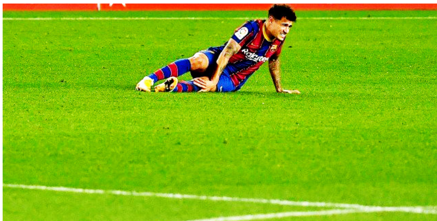
O brasileiro chegou ao Barcelona em 2018 como a contratação mais cara da história do Barcelona

Some-se a isso o fato de ter convivido com as duas situações em São Januário, onde conquistou a Copa do Brasil em 2011 como treinador e foi diretor técnico dois anos depois. Ele trabalharia ao lado de um executivo com conhecimento de mercado na busca por contratações.