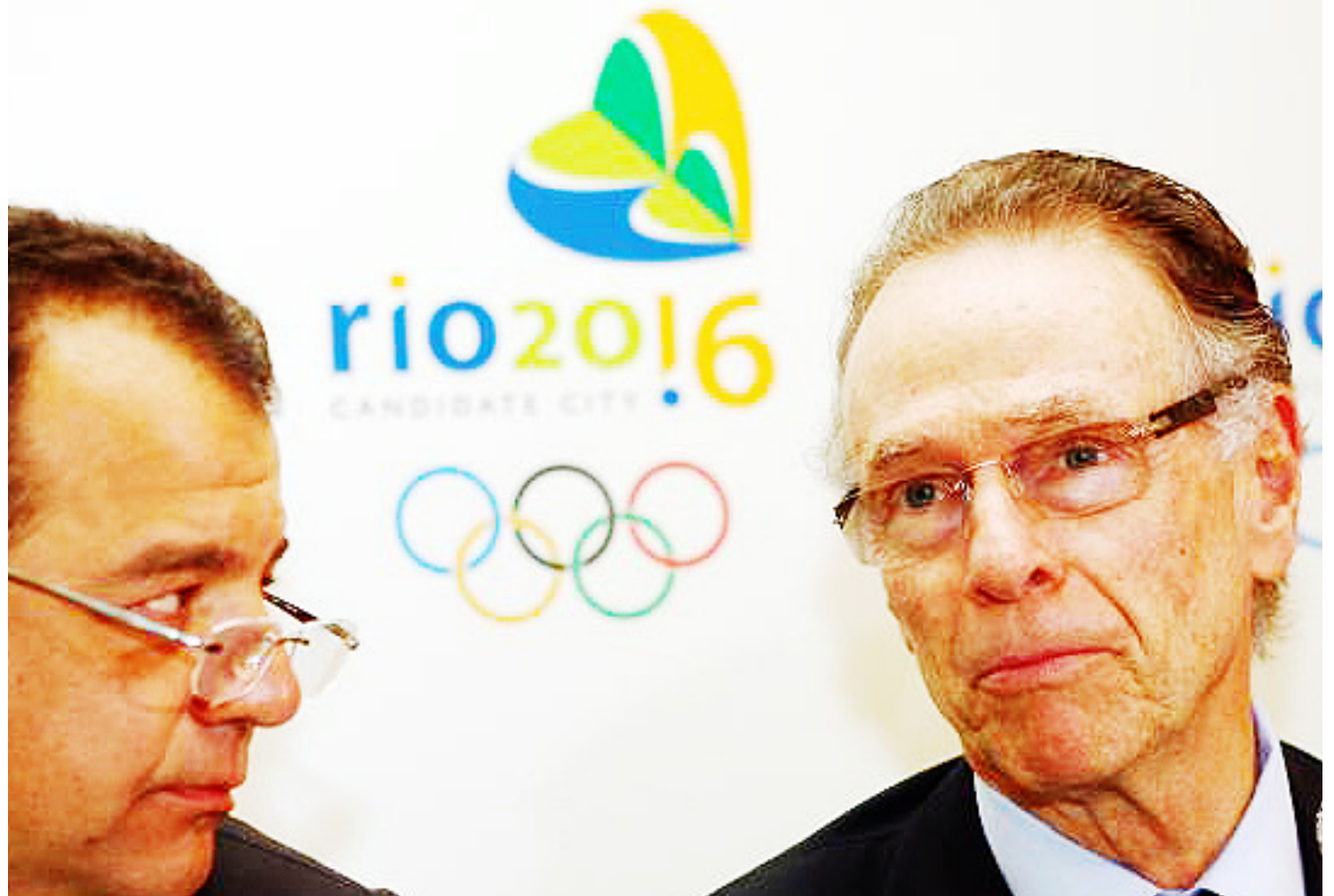
Ex-presidente do COB é acusado de corrupção passiva, organização criminosa, evasão de divisas e lavagem de dinheiro

As acusações são referentes à compra de votos dos integrantes do Comitê Olímpico Internacional (COI) para a eleição do Rio como sede da Olimpíada. Cabral foi condenado a dez anos e oito meses