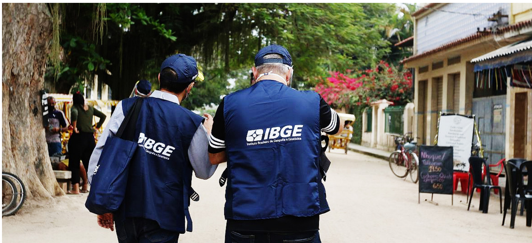
IBGE apresenta índice multidimensional pela primeira vez

O IPQV para pessoa preta ou parda é 0,185 e para pessoa branca, 0,123. “Quando os subgrupos da população são definidos pelas características da família, nos casos em que a pessoa de referência se declarou branca, o valor do IPQV foi de 0,123, notadamente menor que