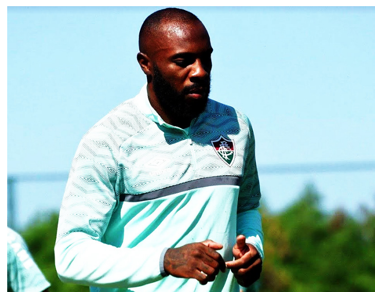
Defensor tem contrato com o clube carioca até 2023

O brasileiro chegou ao Barcelona em 2018 como a contratação mais cara da história do Barcelona, mas ainda não fez jus ao título.