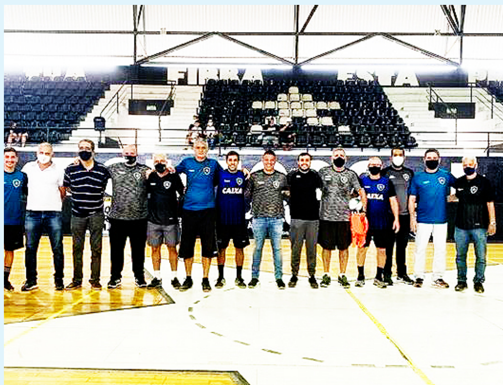
Com a volta do Botafogo à série A, o clube investe na base para formação de atletas.

Neste sábado, acontece a última etapa do ano do processo seletivo do futsal do Botafogo.