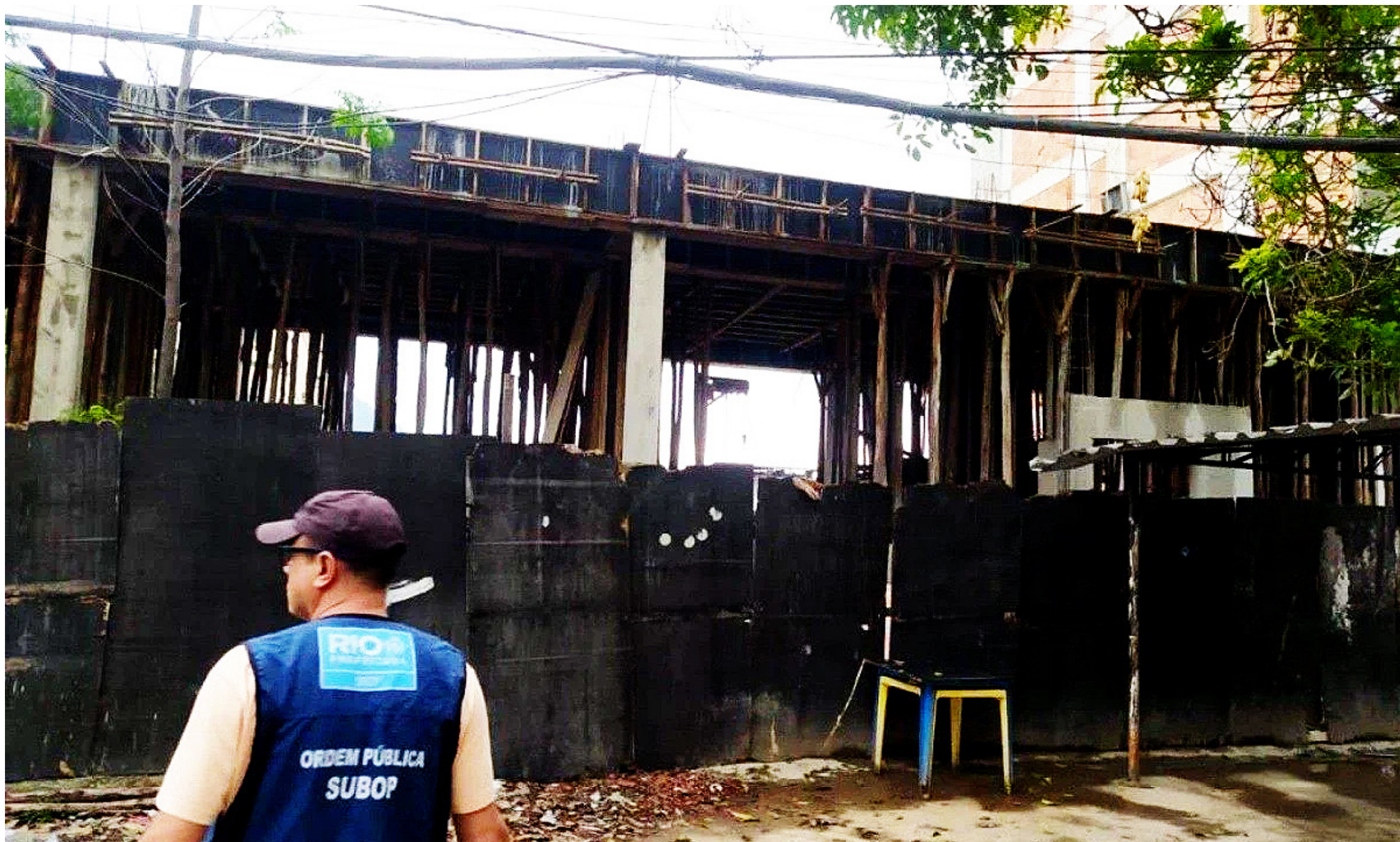
A estimativa é de que tenham sido investidos R$ 2 milhões na obra