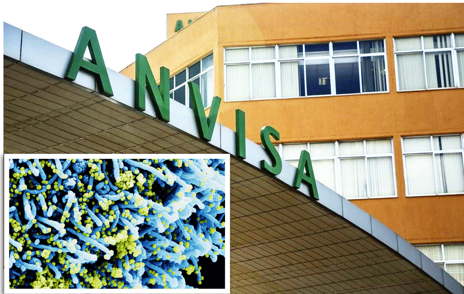
Variante com maior taxa de transmissibilidade está relacionada com baixa vacinação nos países africanos e impõe plano mundial integrado de vacinação

A faixa com menor perda de qualidade de vida concentrava 13,7% da população e a faixa com mais perdas, 10,3%. A maior parte dos brasileiros se encontra na zona intermediária de qualidade de vida.