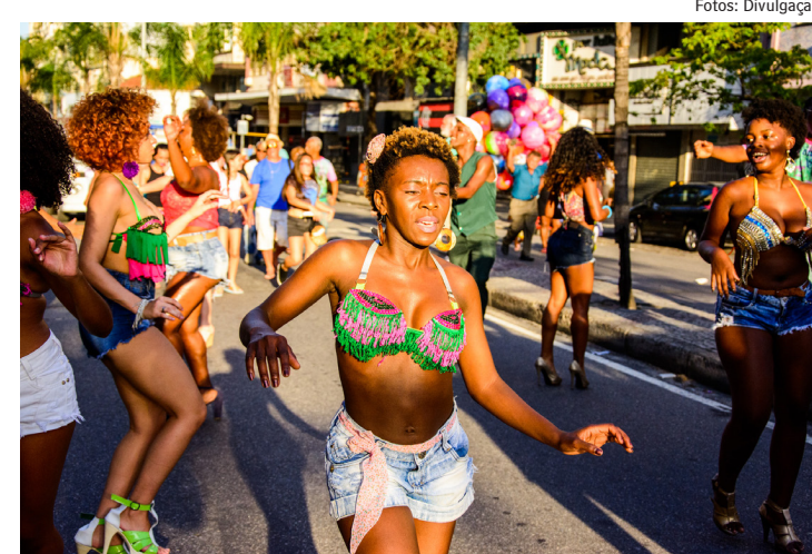
Treino acontece a partir das 15h

E, não para por aí, ao longo da semana acontecem lives literárias, nova edição da FES - Feira de Empreendedores Sustentáveis, em parceria com Casa de Cultura de Jacarepaguá, e muito mais. O encerramento, no dia 12/12, fica por conta do grupo Folia de Reis do Sertão Carioca, no Museu do Pontal.