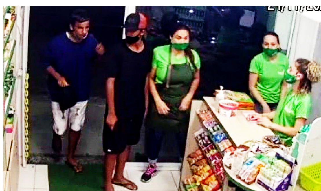
Eles estavam com drogas e uma réplica de pistola

A dupla confessou ter praticado o roubo ao estabelecimento comercial na noite de quarta-feira (24) e também a venda de