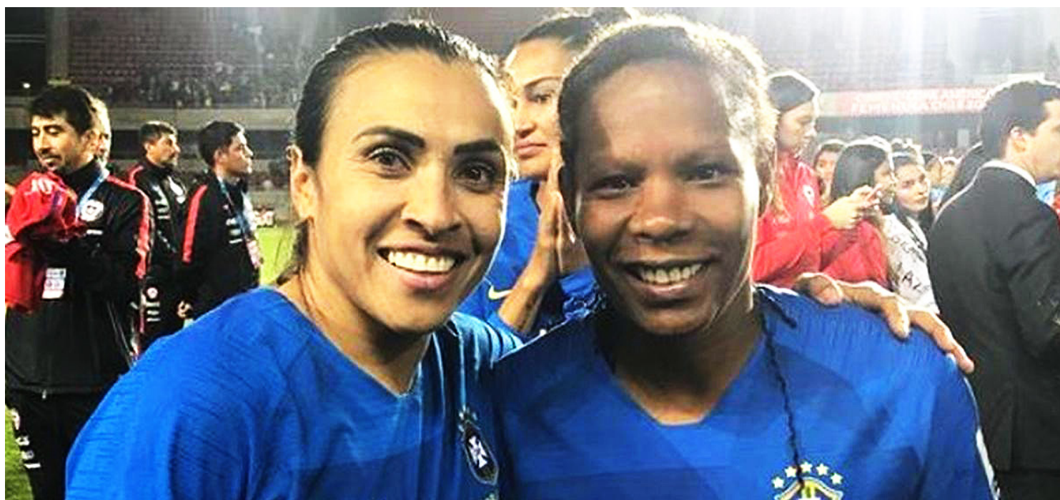
Marta sobre Formiga: “O futebol feminino tem muito a te agradecer”

Através dos comentários, os seguidores deixaram recados carinhosos à jogadora: “Muitas felicidades pras duas e um agradecimento especial a craque Formiga”, “Nem carregou aqui a foto de tão pesada craques”, “Formiga é demais”, “Nunca vai existir trio mais valioso que vocês duas e a Cris. Obrigada por tudo”, foram apenas algumas das mensagens.