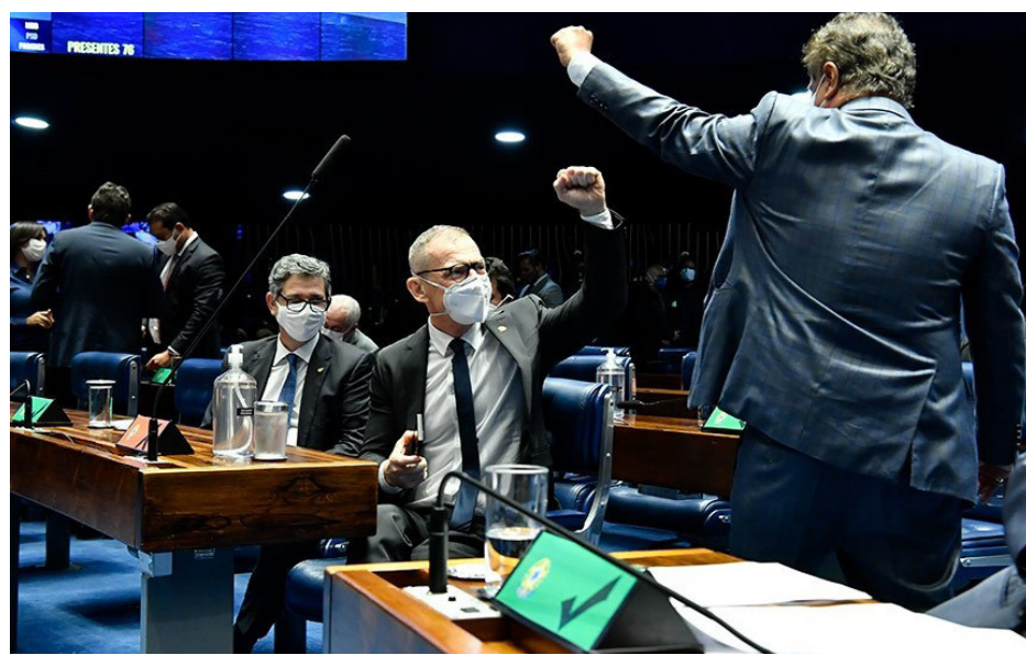
Valor foi aprovado pelo Senado

— Precisou acontecer uma pandemia de alta letalidade para que o valor da enfer-