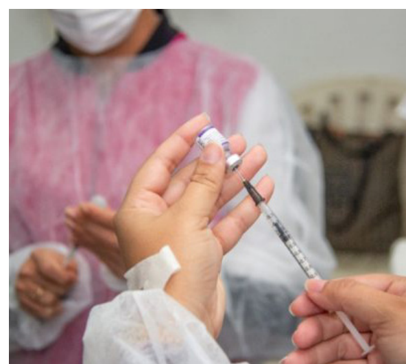
A imunização acontece de 9h às 16h, na Associação dos Aposentados e nos Postos de Saúde do bairro Canaã e dos distritos de Figueira e Monte Alto

A expectativa de grande circulação de consumidores na cidade, especialmente no Calçadão, um dos maiores centros comerciais do estado, fez com que o programa Nova Iguaçu Mais Seguro - PROEIS elaborasse um planejamento especial de policiamento, que envolverá também o Segurança Presente e o 20º BPM. A ação entrará em vigor a partir do dia 1º de dezembro e se estenderá até 10 de janeiro.