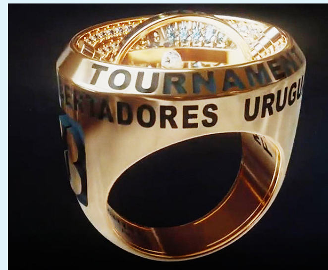
O anel de diamantes tem o desenho inspirado no estádio Centenário

PALMEIRAS: Weverton, Gustavo Gómez, Felipe Melo e Luan; Mayke, Danilo, Zé Rafael e Piquerez; Raphael Veiga e Dudu; Rony.