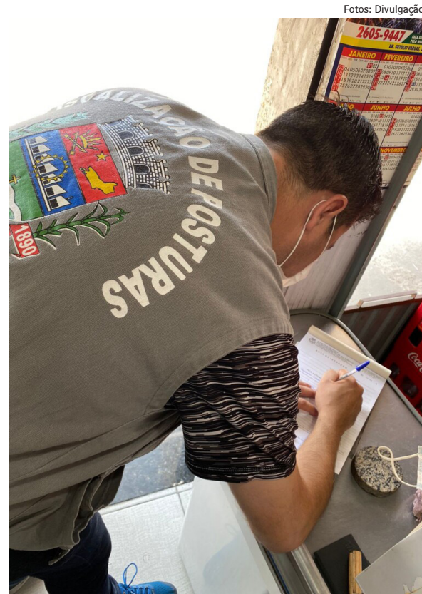
Campanha “Limpa São Gonçalo” segue com orientação e fiscalização

O atendimento será oferecido de segunda a sexta-feira, das 08h às 17h, na Rua Jobel José Cardoso, Nº 1.621. O encaminhamento deverá ser feito pelo clínico geral, nas Estratégias de Saúde da Família (ESFs), para cada uma das especialidades.