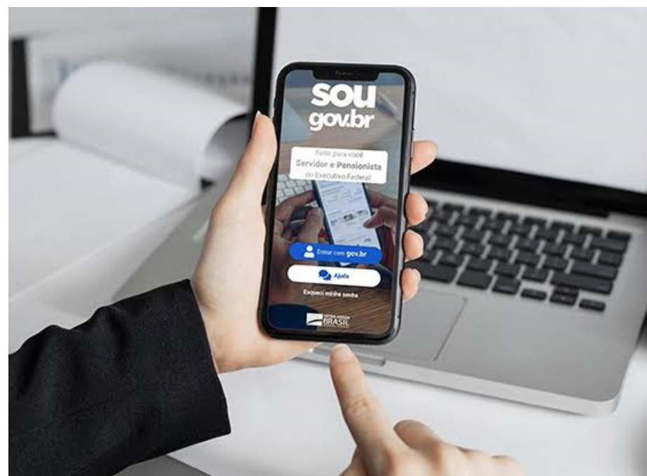
O documento a ser preenchido está disponível no aplicativo e na versão web do SouGov.br

Os profissionais, então, serão chamados às coordenadorias para escolha da nova unidade escolar em que desejam trabalhar. Essa etapa acontecerá entre 6 e 8 de dezembro, para quem busca transferência na CRE em que já atua, e em 13 e 14 de dezembro, para os demais.