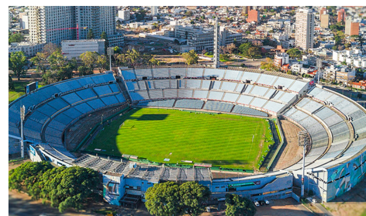
Flamengo e Palmeiras se enfrentam no próximo dia 27, às 17h

No momento, a carga de ingressos para a torcida do Flamengo em Montevideo é de 9.375. Contudo, caso o aumento da capacidade seja realmente aprovado, o setor rubro-negro na final deve receber 11.700 adeptos. Vale destacar que a Conmebol não pretende utilizar todos os 60 mil lugares disponíveis no Estádio Centenário. A previsão da entidade e do Governo do Uruguai é de que 46 mil entradas sejam comercializadas.