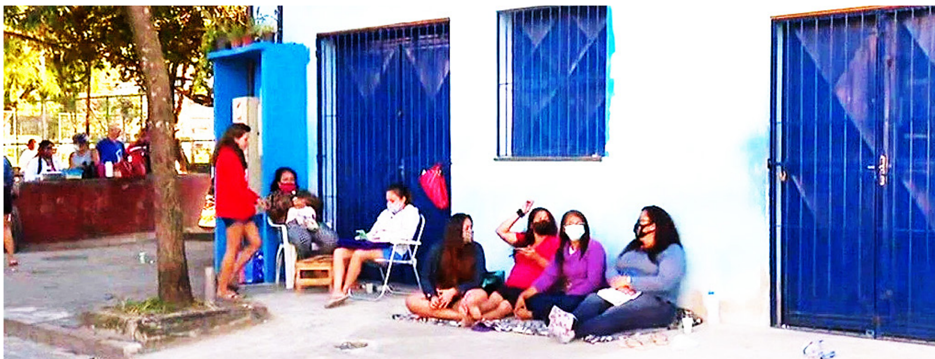
Em Paciência, na Zona Oeste do Rio, o Centro de Assistência Social abriu mais cedo para receber as pessoas