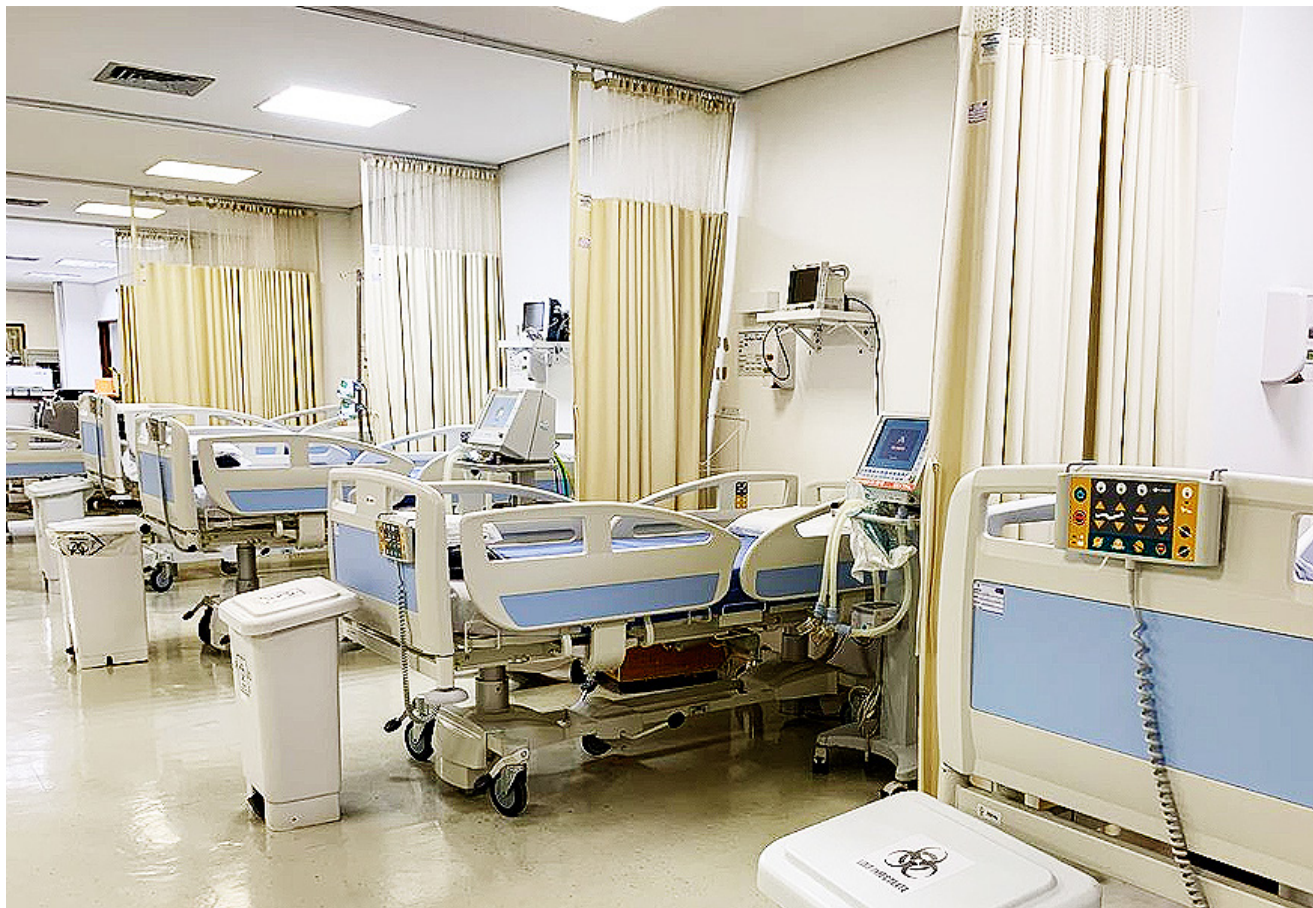
Contratos temporários dos profissionais vencem no dia 30 de dezembro

A direção-geral informou que tem articulado com as esferas federal, estadual e municipal para manter os contratos