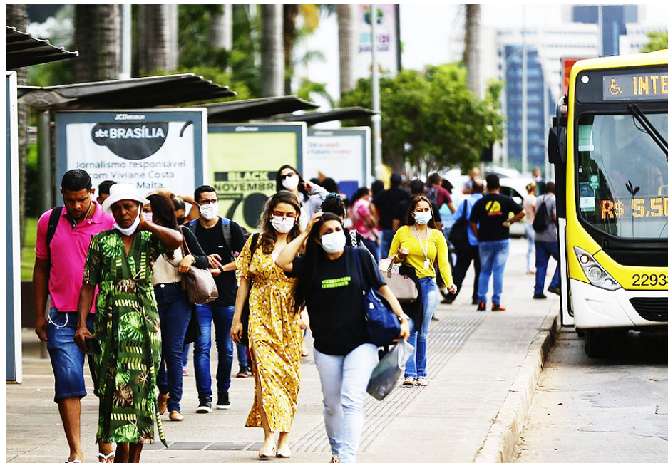
Desde o início da pandemia, 611.346 pessoas morreram da doença

Também foram aplicadas 498.732 doses adicionais e 11,2 milhões de doses de reforço.