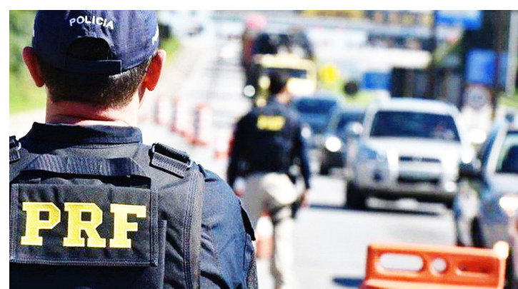
Os 8.455 policiais que atuaram nos serviços operacionais

Dos 15.245 testes feitos com bafômetros, 93 resultaram em prisão, em meio a 920 autuações por alcoolemia. “A cada 16 testes feitos em condutores, um resultou em flagrante por condução sob efeito de álcool;