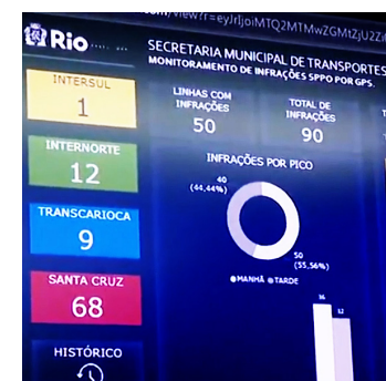
Consórcio Transcarioca é o que mais apresenta oscilações

Começou ontem mais uma etapa da fiscalização por GPS das linhas de ônibus do Rio. Mas a fiscalização não será para todas as linhas, como a prefeitura tinha anunciado. Serão monitoradas 294 linhas, que se não estiverem rodando com a frota determinada, serão multadas.