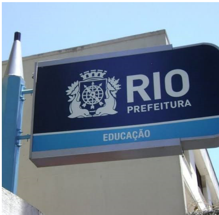
Interessados devem se cadastrar pelo site

As classificações finais serão divulgadas no Diário Oficial no próximo dia 25,