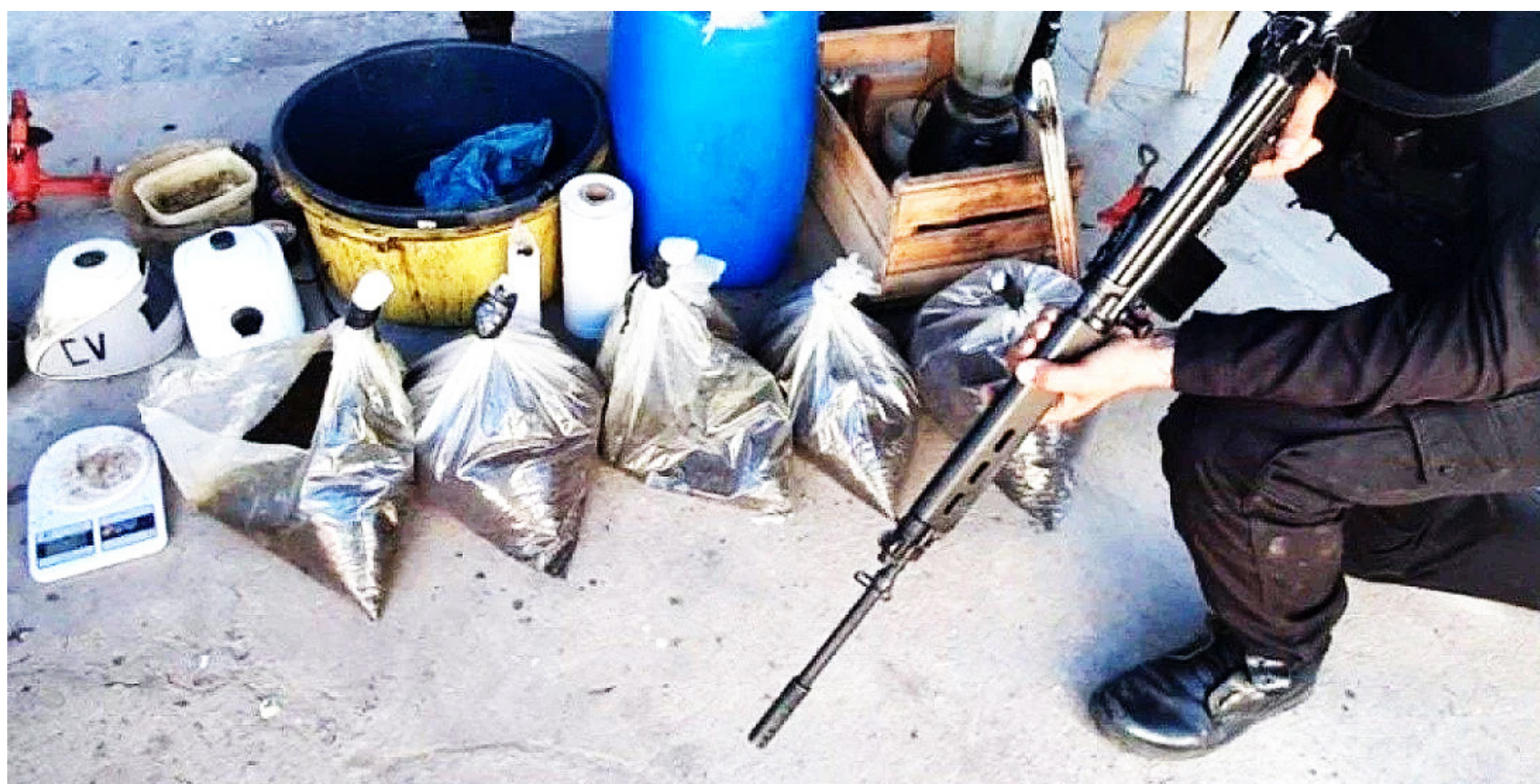
Foram encontradas drogas, material para embalar as drogas, facas, uma balança de precisão, carregadores de fuzil e um rádio comunicador