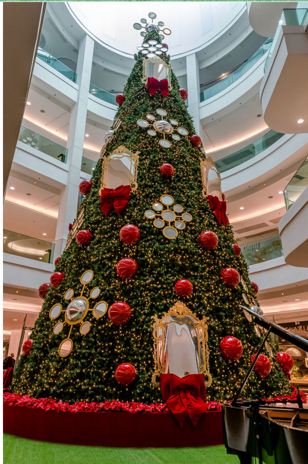
O shopping entra no clima natalino com a volta do Papai Noel presencial

ção de brinquedos a crianças com deficiências de instituições parceiras da Rioinclui, obra social sem fins lucrativos, como o Lar Dona Meca. Para isso, serão arrecadados itens em bom estado que poderão