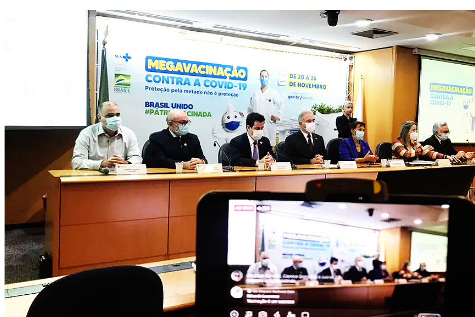
Queiroga explicou que o ministério não divulgará um calendário por faixa etária para a tomar a dose adicional

“Hoje nós sabemos que é necessária uma proteção adicional dessa vacina. Como temos um quantitativo, não será um esforço muito grande. A sequência é: completou cinco meses da segunda dose, receberá uma dose de reforço, preferencialmente com uma vacina dife-