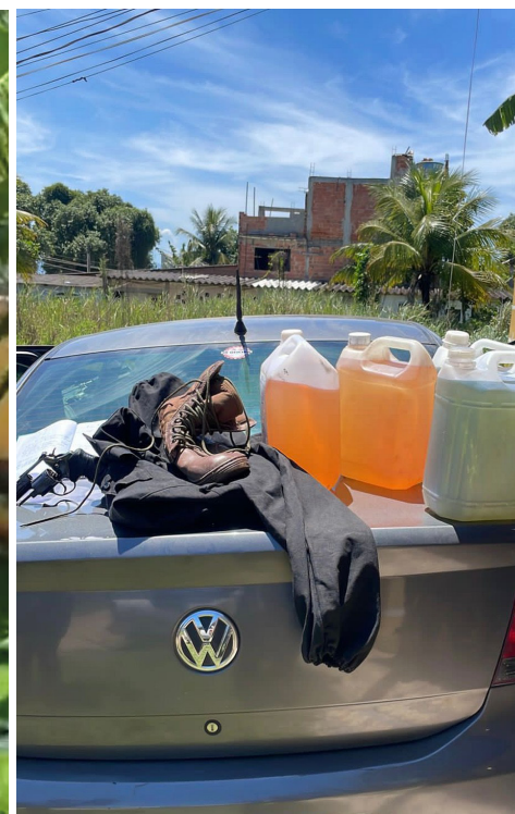
Agentes apreenderam galões de combustível que seriam utilizados no homicídio. Na ação, 15 pessoas foram presas