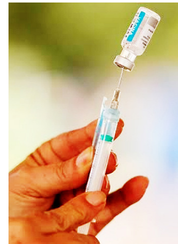
Rio prevê começar a terceira dose em não idosos apenas em dezembro