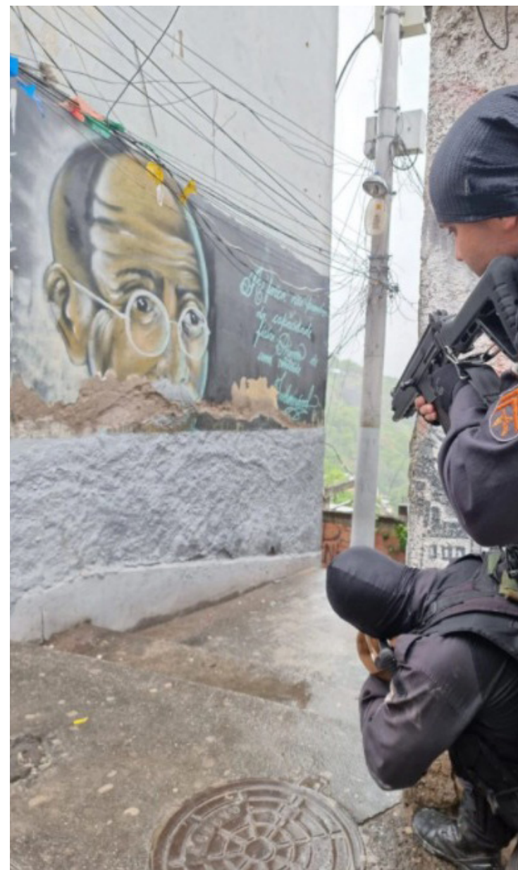
Com ele, equipes apreenderam uma pistola