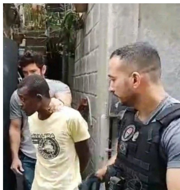
Petróleo teria participado da tortura de um morador da comunidade

Petróleo é integrante do Comando Vermelho e estava abrigado em outra região desde que foi jurado de morte pela cúpula da facção.