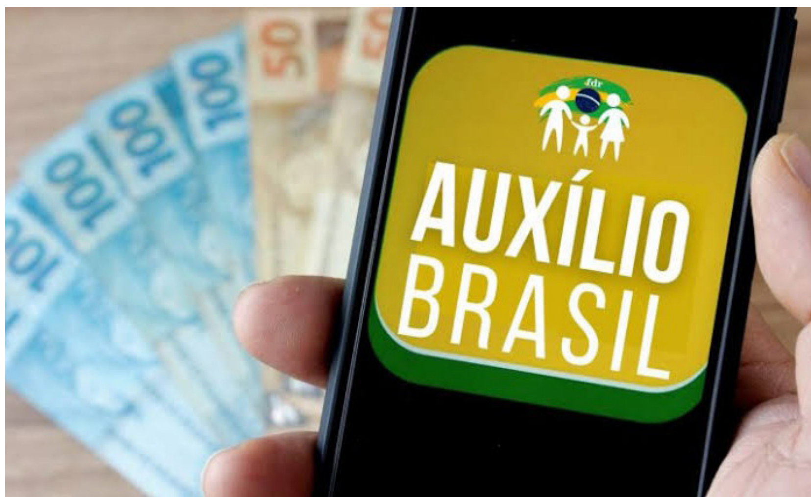
Novo auxílio irá manter o calendário do Bolsa Família

O Governo Federal começa a pagar no próximo dia 17 de novembro o Auxílio Brasil, programa que substitui o Bolsa Família.