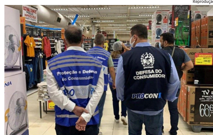
Ação foi realizada na Baixada Fluminense

A PEC foi aprovada na Câmara dos Deputados, na noite de terça-feira (9) em segundo turno. O texto segue para análise do Senado, onde também precisa ser aprovado em dois turnos, com, pelo menos, dois terços de votos favoráveis.