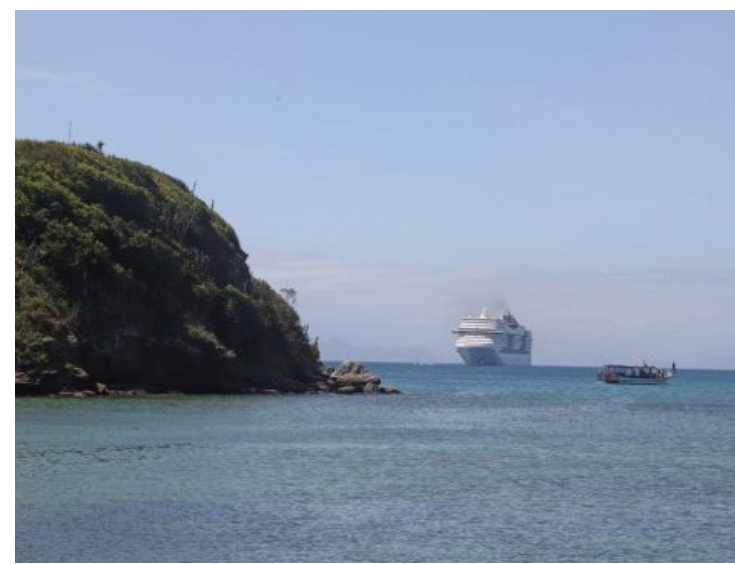
O primeiro navio aportou na sexta (12), às 11h. Já no sábado (13), o segundo chega às 9h

Caxias Shopping está retomando o Projeto Ateliarte