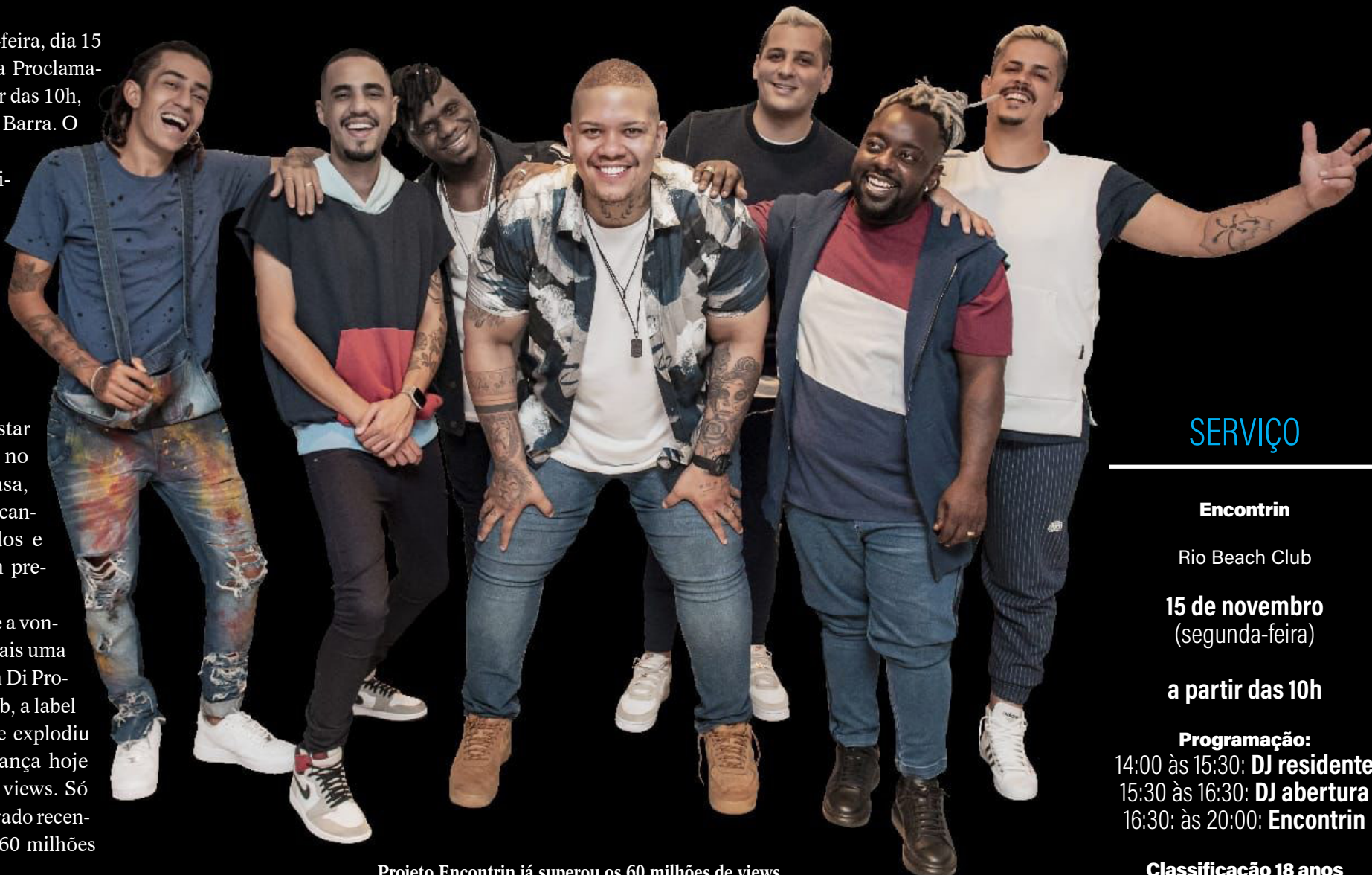
Projeto Encontrin já superou os 60 milhões de views

É nesse clima, pagode a vontade, que tá chegando mais uma edição do Encontrin com Di Propósito no Rio Beach Club, a label do grupo de pagode que explodiu nesse último ano e alcança hoje mais de 200 milhões de views. Só o projeto Encontrin, gravado recentemente, já superou os 60 milhões de views.