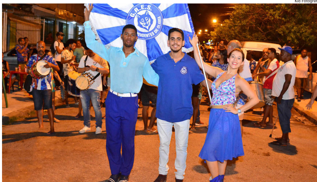
A Independentes de Olaria será a 6ª agremiação a desfilir na segunda-feira de carnaval na Intendente Magalhães, dia 28 de fevereiro.