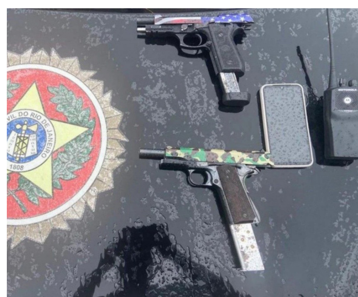
Duas pistolas foram apreendidas

o suspeito passou a se dedicar recentemente ao tráfico de animais silvestres, despertando a atenção da DPMA. Ele então passou a ser monitorado pela DPMA e acabou preso.