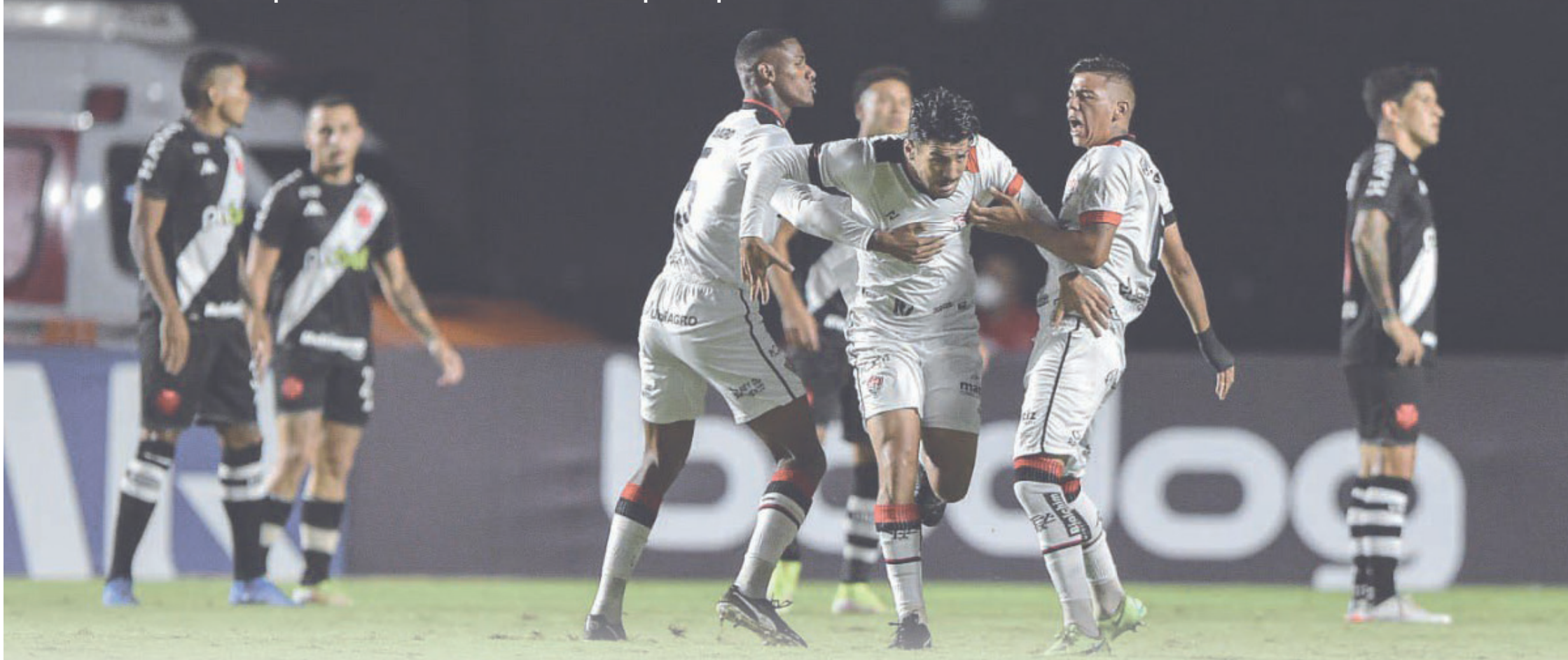
Vasco enterrou suas chances de acesso à Série A ao perder para o Vitória (BA) dentro de São Januário.

Além de lembrar os tristes fatos ocorridos na eleição de um ano atrás, o gigante da colina chora a permanência na Série B pela primeira vez em sua história. Será mero acaso?