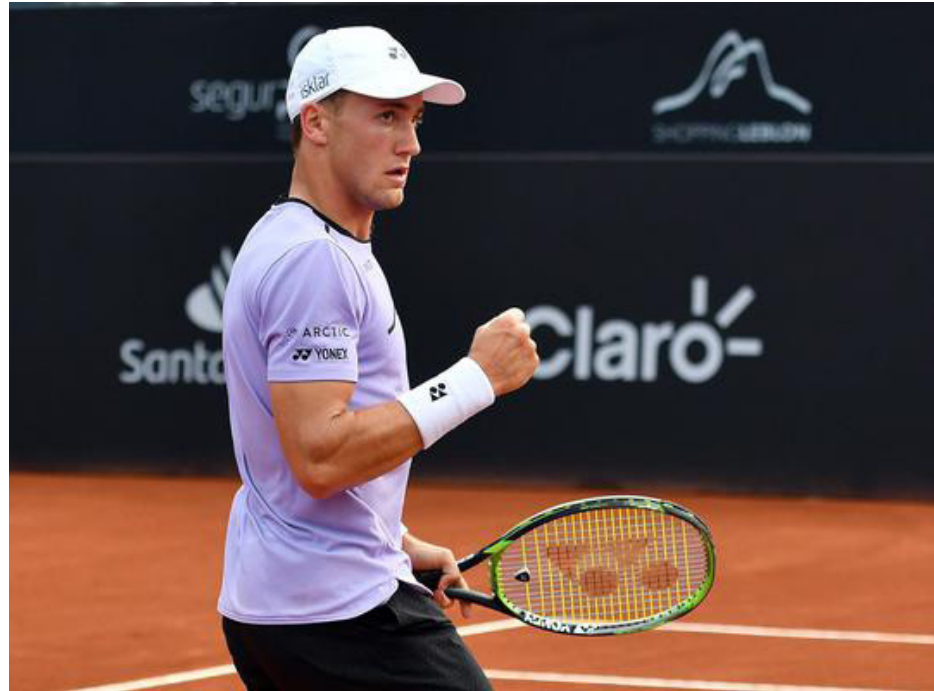
Casper Ruud e Pablo Carreño Busta se juntam a Berrettini e Alcaraz