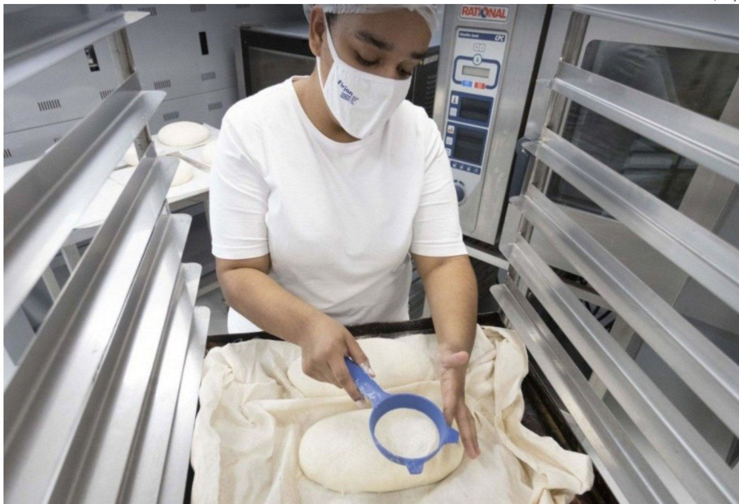
As oportunidades estão distribuídas em 16 unidades

As oportunidades estão distribuídas em 16 unidades, para aulas em turno integral em 2022.