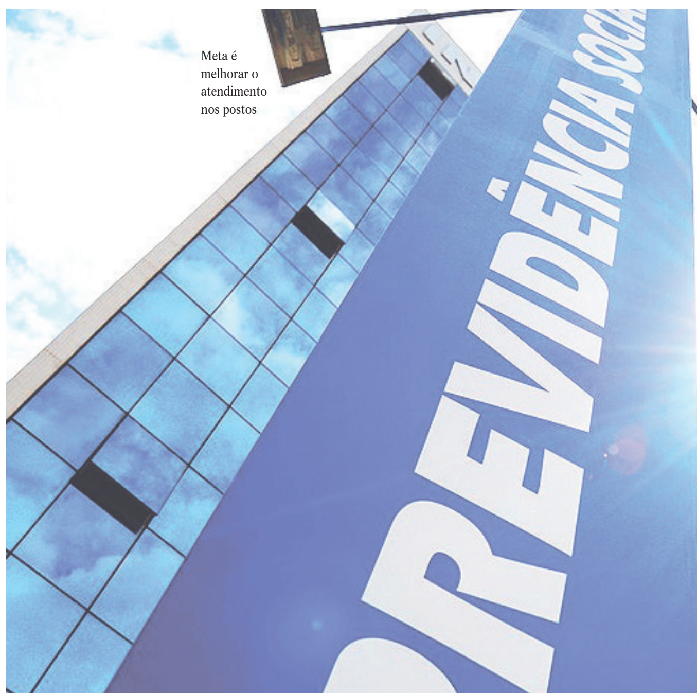
Meta é melhorar o atendimento nos postos