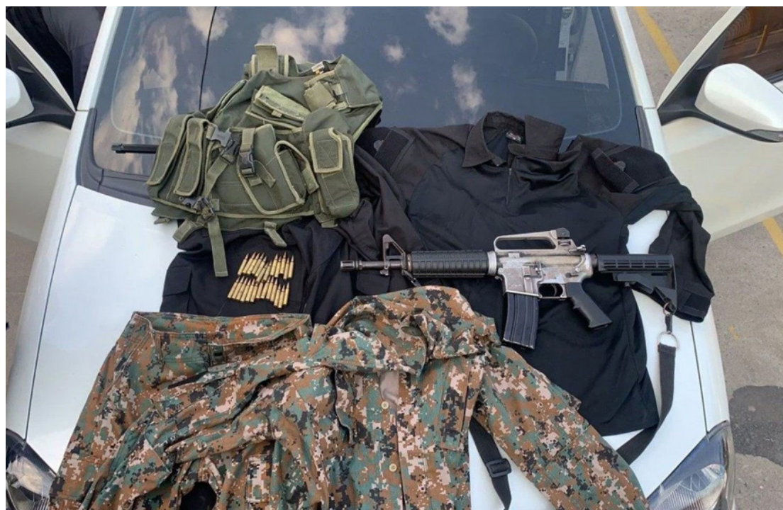
Uniformes, fuzil, carregador e colete foram encontrados

dos pela vítima foram detalhados aos policiais. Além dos golpes e da tentativa de facada, ela também teria sido ameaçada de morte por diversas vezes. A localização dele foi descoberta nesta terça-feira e a prisão efetuada. Segundo a Secretaria de Estado de Polícia Civil, o acusado responderá pelos crimes de tentativa de feminicídio e ‘stalking’.