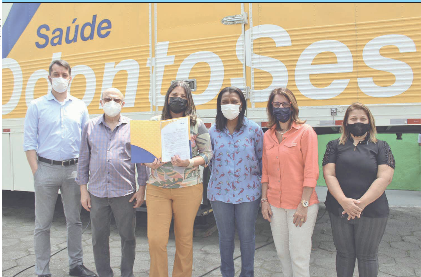
A unidade móvel permanecerá até dezembro prestando atendimento