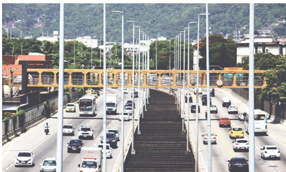
Tal medida será adotada com o objetivo de dar maior fluidez ao trânsito

A reversível da Linha Amarela é exclusiva para automóveis e funcionará nos dias úteis, das 6h às 9h. Durante seu funcionamento, uma faixa de circulação extra será disponibilizada para os veículos que trafegam da região de Jacarepa-