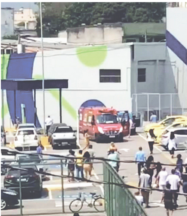
Crime ocorreu em Campo Grande