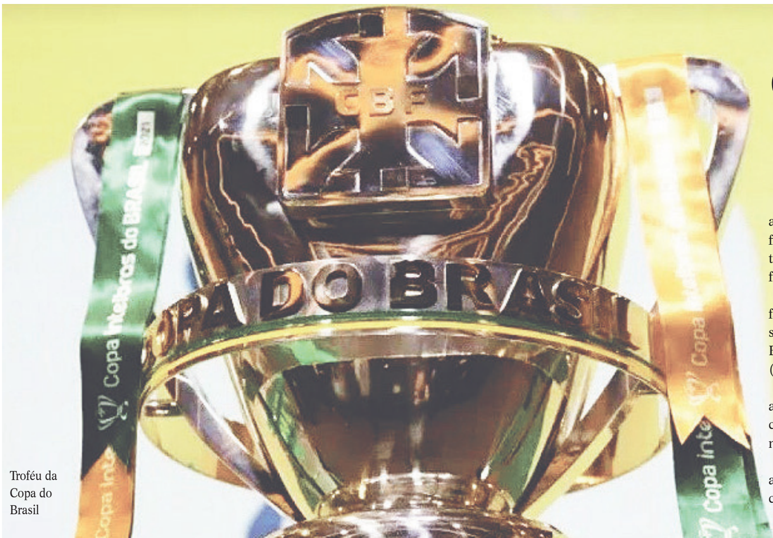
Troféu da Copa do Brasil

A CBF precisará fazer essas mudanças porque decidiu adiar jogos na Data Fifa em setembro e em outubro dos clubes que têm jogadores cedidos para a seleção brasileira.