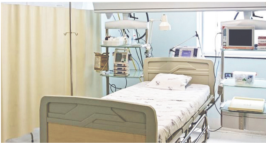
Número é o menor desde o início da pandemia

“Estamos vendo uma redução no número de casos graves e internações e isso está certamente ligado ao avanço da vacinação em todo o estado.