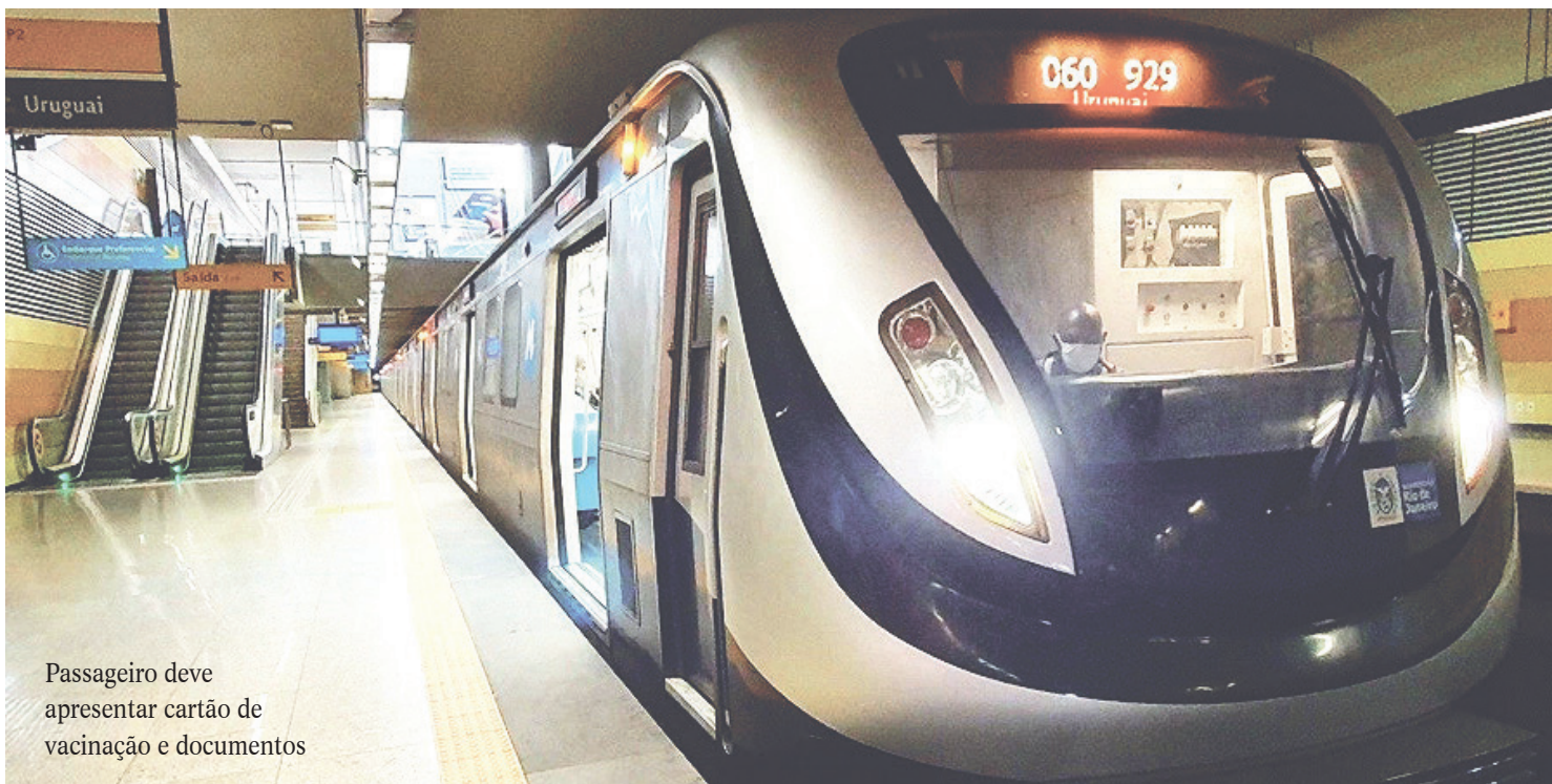
Passageiro deve apresentar cartão de vacinação e documentos