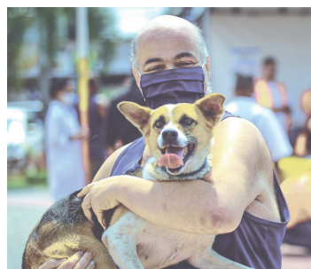
Foram imiunizados 11.160 animais (cães e gatos)

A Prefeitura de Belford Roxo realizou no último sábado (25/09), o Dia D da campanha de vacinação antirrábica. Agentes de Combate as Endemias (ACEs) do Departamento de Controle de Vetores e Zoonoses da Secretaria de Saúde, estiveram em 10 pontos de vacinação espalhados pela cidade. Foram imiunizados 11.160 animais (cães e gatos).