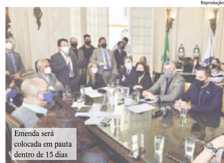
Emenda será colocada em pauta dentro de 15 dias

Já o Programa de Estágio, vai selecionar jovens potenciais ainda em período de formação para prepará-los para assumir desafios na Ambev quando tiverem concluído seus cursos. Assim como o Trainee, o processo ocorre às cegas para os talentos não serem avaliados por idade, gênero, curso ou faculdade.