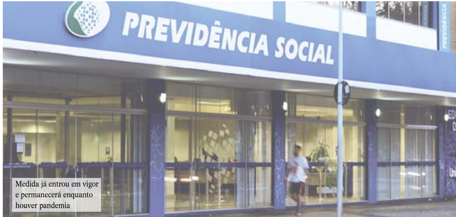
Medida já entrou em vigor e permanecerá enquanto houver pandemia

No início da pandemia, em março do ano passado, todos os serviços do INSS que eram realizados presencialmente foram suspensos. A medida foi tomada levando em consideração também os fatores de risco do público