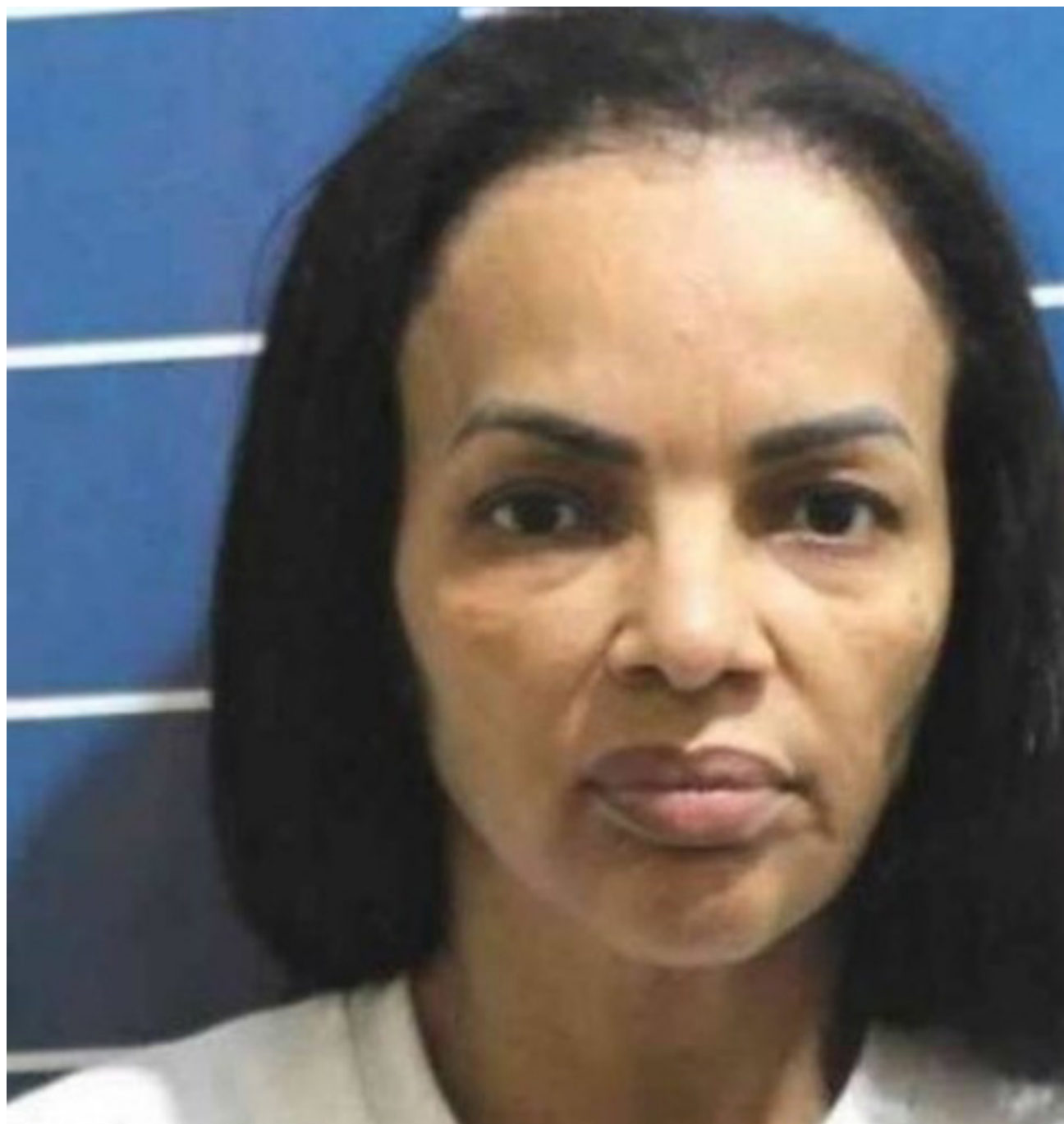
Nearis foi responsável por decretar a prisão da ex-deputada

"Opiniões divergentes e o debate de ideias opostas, deduzidas processualmente após a deflagração da ação penal, são inerentes à própria dialética do direito e do processo. São fatos aceitáveis. As partes podem ficar insatisfeitas com as decisões que contrariem os seus interesses, mas existem as vias recursais para reexame da questão. O direito, porém, não tolera que os inconformismos venham travestidos de alegações levianas de parcialidade contra o magistrado. Nenhuma das hipóteses escortinadas pela nobre defesa foi capaz de promover qualquer abalo na imparcialidade da magistrada", escreveu o desembargador Celso Fer-