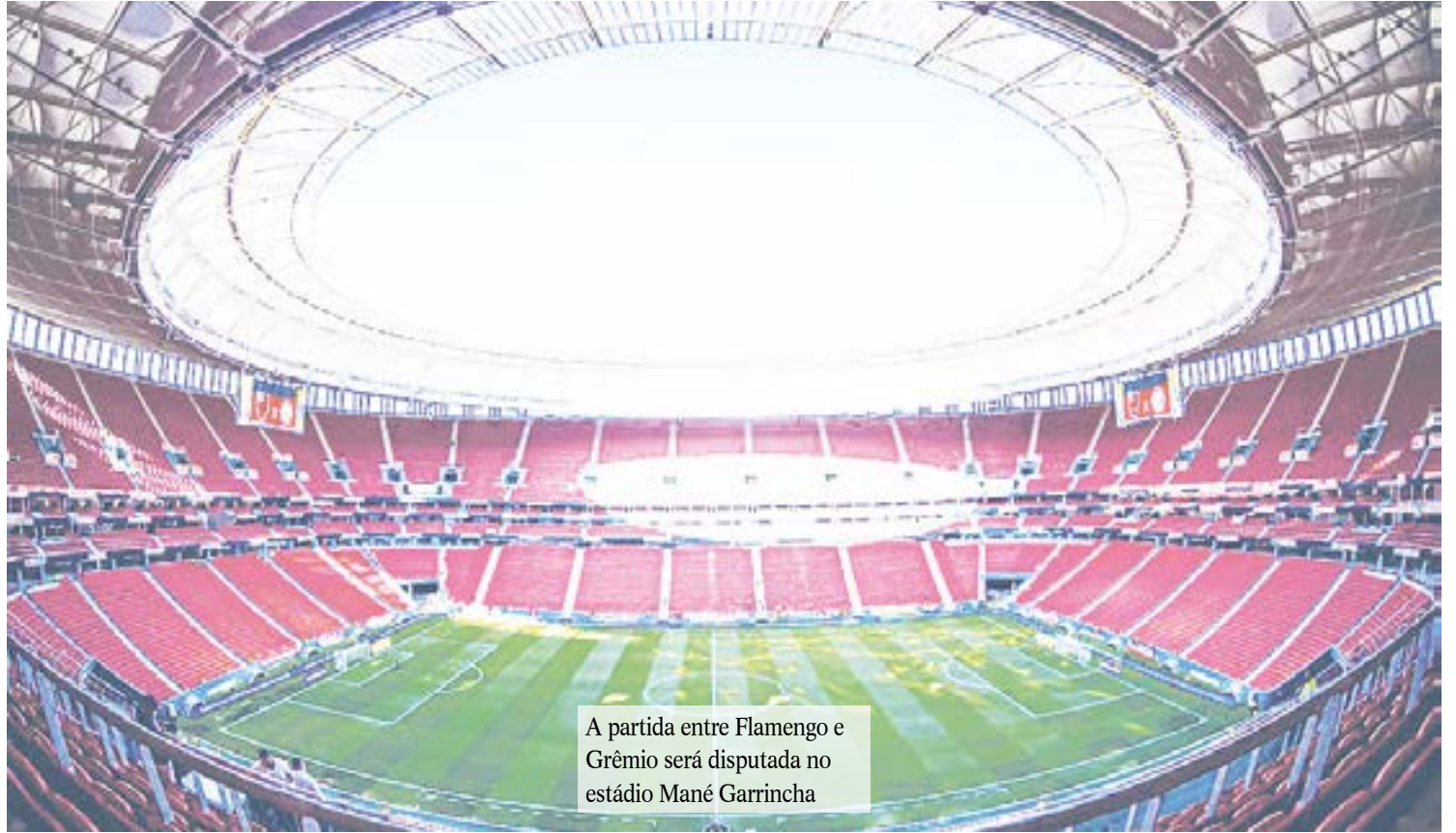
A partida entre Flamengo e Grêmio será disputada no estádio Mané Garrincha

O elenco do Flamengo se reapresenta na tarde desta quarta-feira. O time inicia a preparação para enfrentar o Palmeiras, no próximo dia 12 de setembro, em São Paulo.