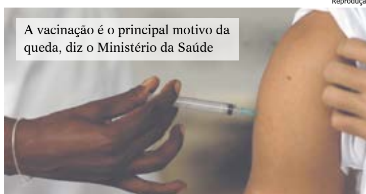
A vacinação é o principal motivo da queda, diz o Ministério da Saúde

“Isso representa uma redução de 65% em pouco mais de dois meses”, informou o ministério, em nota, ao esclarecer que a média móvel é um balanço do número de casos registrados nos últimos 14 dias. O levantamento aponta também queda na média móvel de mortes. Ontem, o Brasil registrou 701 mortes, o que representa o menor índice desde 6 de janeiro, quando