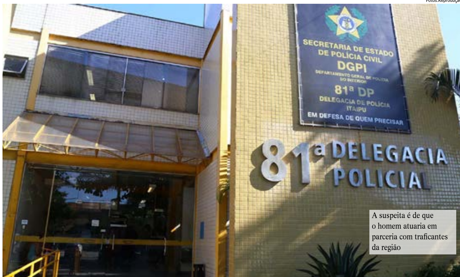
A suspeita é de que o homem atuaria em parceria com traficantes da região

Os policiais realizaram diligências e identificaram a central clandestina que emitia os sinais irregulares. O material foi apreendido e encaminhado para a 81ª DP. O homem foi preso em flagrante.