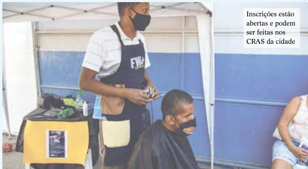
Inscrições estão abertas e podem ser feitas nos CRAS da cidade

Os encontros acontecerão uma vez por semana