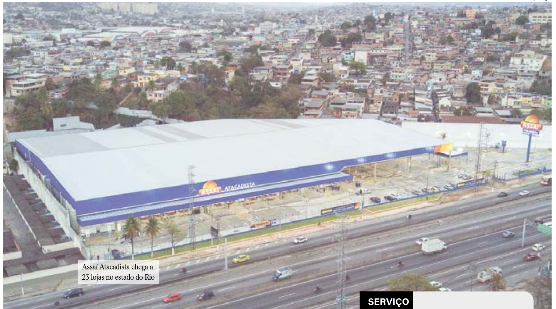
Assaí Atacadista chega a 23 lojas no estado do Rio

companhia gerou mais de 280 empregos diretos na região.