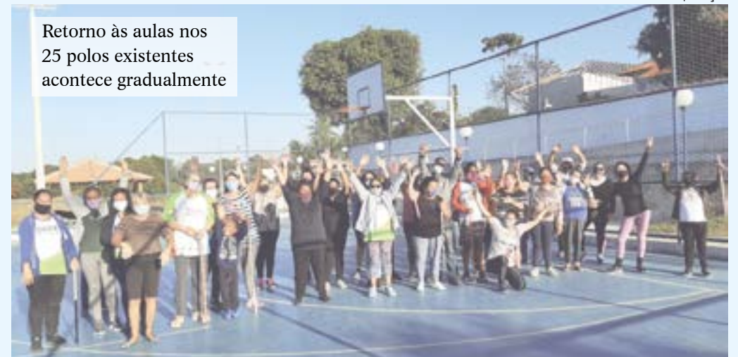
Retorno às aulas nos 25 polos existentes acontece gradualmente

As aulas continuam à distância. Os alunos matriculados na rede municipal de ensino têm acesso às atividades escolares através do site www.ead-semjaperi.com.br , portal que é abastecido regularmente pelos educadores. Aqueles que não têm acesso à internet ou impressora podem retirar o material impresso diretamente na unidade de ensino onde estão matriculados.