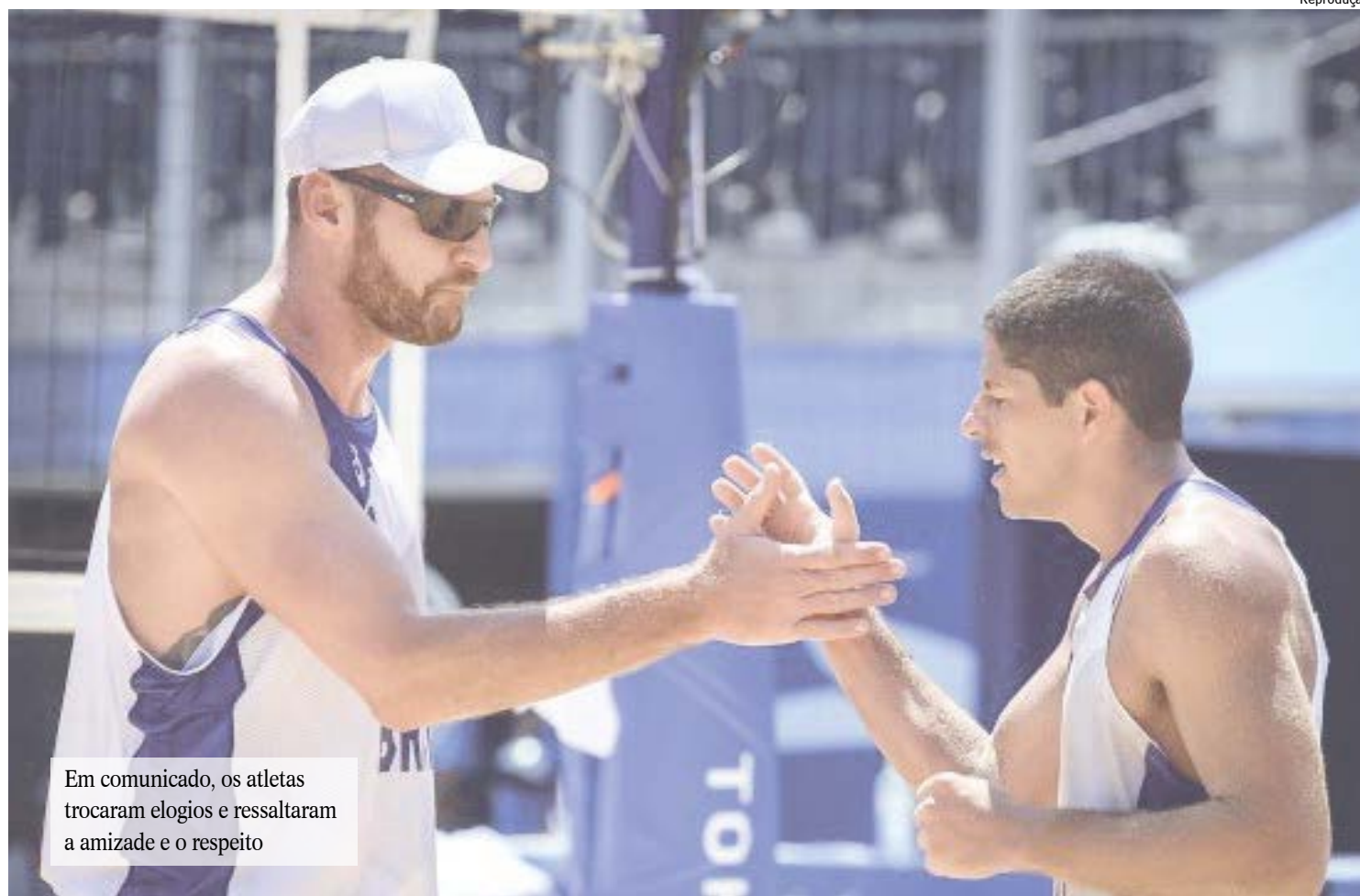
Em comunicado, os atletas trocaram elogios e ressaltaram a amizade e o respeito

em quarto no ranking mundial de 2020. Juntos, conquistaram títulos como os das etapas de Kuala Lumpur (Malásia) e Espinho (Portugal), além dos vice-cam-