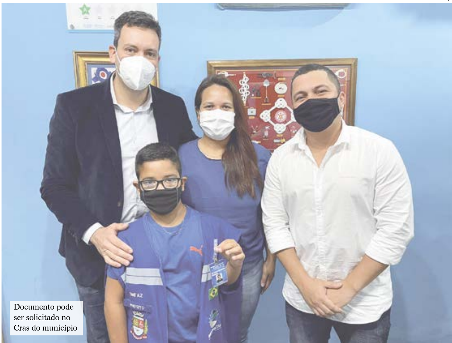
Documento pode ser solicitado no Cras do município

A emissão da Carteira Municipal de Identificação do Autista está prevista na Lei Municipal nº 1.279, de autoria do vereador Renato Fifiu, e sancionada em 2 de abril de 2020, pelo Prefeito Alan Bombeiro. O documento, que pode ser solicitado nos CRAS do município, visa facilitar a identificação e a prioridade no atendimento em serviços públicos e privados, em especial nas áreas de saúde, educação e assistência social, para portadores do Transtorno do Espectro Autista.