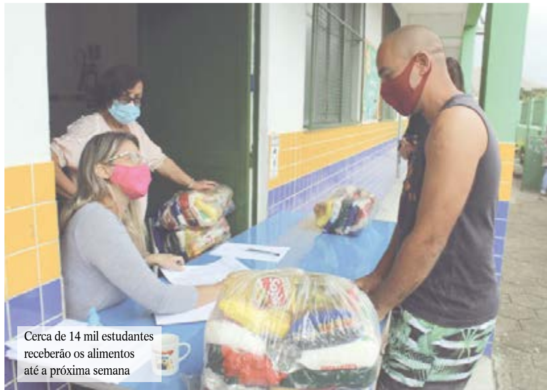
Cerca de 14 mil estudantes receberão os alimentos até a próxima semana

Com as escolas municipais fechadas em virtude da pandemia do novo coronavírus, a Prefeitura de Japeri está revertendo os alimentos que fazem parte da merenda escolar em kits complementares de alimentação para todos os alunos da rede municipal de ensino. Na terça-feira (31), a Secretaria Municipal de Educação iniciou a primeira etapa do calendário de entregas. No total, a iniciativa vai contemplar 14 mil estudan-