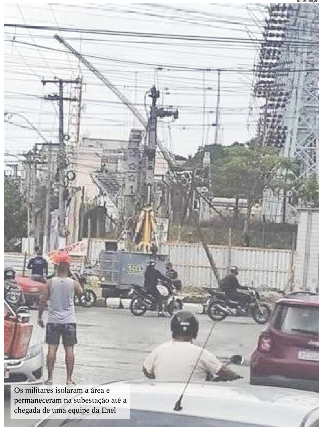
Os militares isolaram a área e permaneceram na subestação até a chegada de uma equipe da Enel

O viaduto em que as vítimas estavam trabalhando faz parte do plano de obras que estão sendo executadas pelo DER, que tem como objetivo melhorar a circulação na região de São Gonçalo.