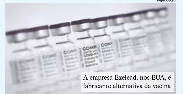
A empresa Exelead, nos EUA, é fabricante alternativa da vacina

Com a inclusão, a cadeia produtiva da vacina da Pfizer tem agora oito empresas distribuídas nos Estados Unidos, Alemanha, Áustria e Bélgica.