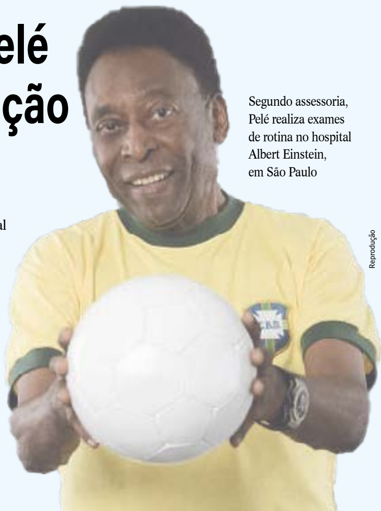
Segundo assessoria, Pelé realiza exames de rotina no hospital Albert Einstein, em São Paulo

“Pessoal, eu não desmaiei e estou muito bem de saúde. Fui fazer meus exames de rotina, que não havia conseguido fazer antes por causa da pandemia. Avisei que eu não jogo no próximo domingo”, falou nas redes sociais.