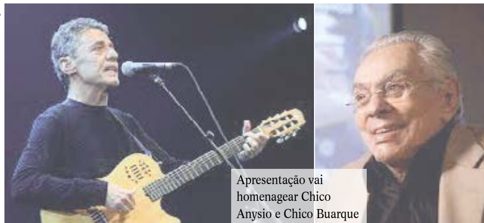
Apresentação vai homenagear Chico Anysio e Chico Buarque