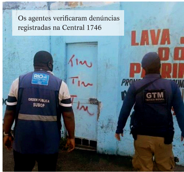
Os agentes verificaram denúncias registradas na Central 1746

A operação contra lava-jatos clandestinos já foi realizada em outros bairros como Jacarepaguá, Freguesia, Taquara, Pechincha, Bento Ribeiro, Rocha Miranda, Cascadura, Turiaçu, Madureira, Benfica e Realengo. Novas ações serão realizadas com foco no combate às ilegalidades.