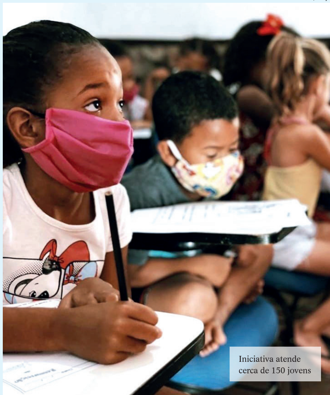
Iniciativa atende cerca de 150 jovens