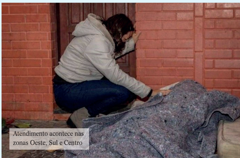
Atendimento acontece nas zonas Oeste, Sul e Centro