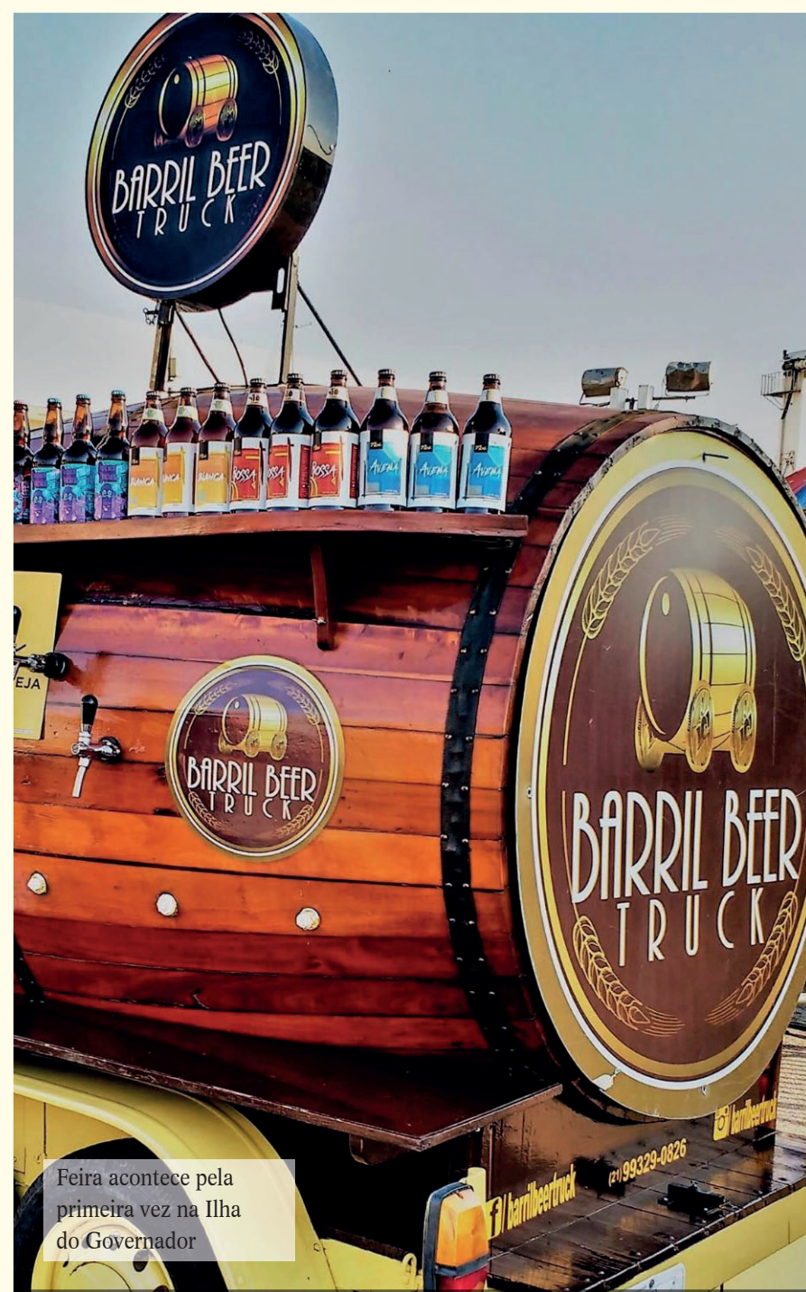
Feira acontece pela primeira vez na Ilha do Governador

A entrada é gratuita, mas doações de água, alimentos e itens de higiene serão bem-vindas para serem doados ao projeto social Amigos pela Caridade, que atende quatro abrigos no Rio de Janeiro.