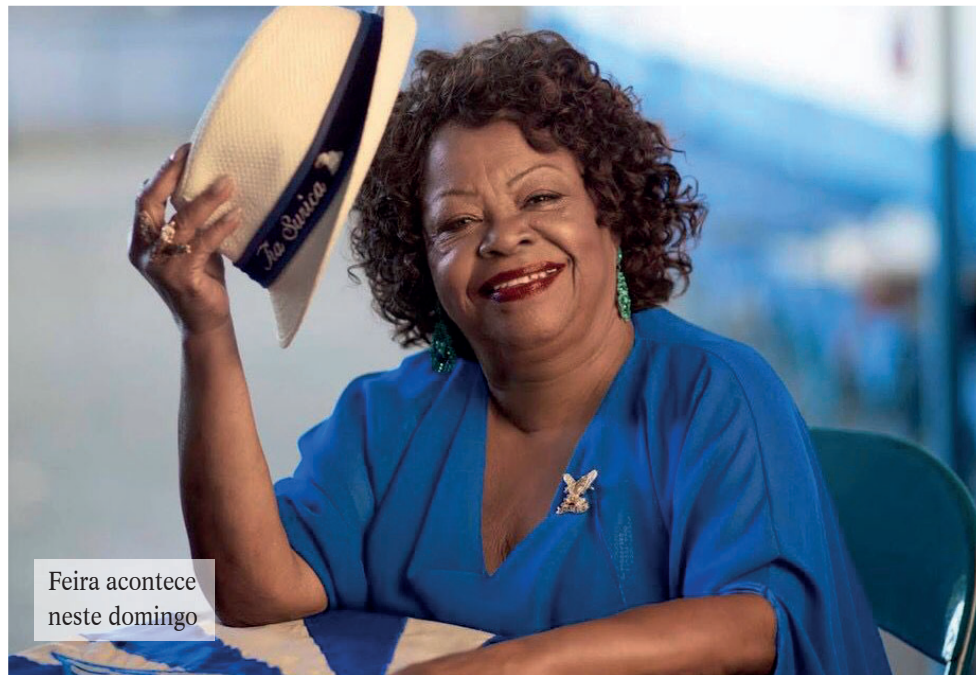
Feira acontece neste domingo

Vem reunindo, desde sua criação, milhares de pessoas, com o objetivo de prestar homenagem às influências africanas na região, tanto na música quanto na gastronomia, e às Tias de Madureira, verdadeiras Yabás, que acolhem e alimen-