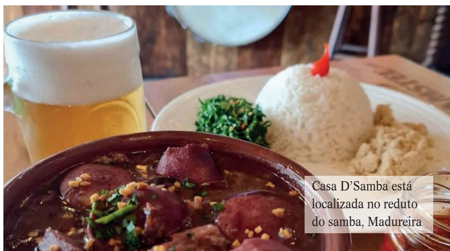
Casa D'Samba está localizada no reduto do samba, Madureira

Se reinventar é a ação mais realizada por empresários durante a pandemia da covid-19. Com esse lema, a Casa D'Samba reabriu suas portas com uma nova proposta conceitual, mas nunca deixou de lado a sua origem: o samba de raiz. Localizada no reduto do samba, Madureira, na Zona Norte, a Casa fica ao lado da quadra da Portela e tem parada obrigatória para aqueles que gostam de curtir um happy hour no final do dia.