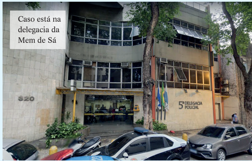
Caso está na delegacia da Mem de Sá

De acordo com a polícia, neste golpe, uma empresa convence a vítima - normalmente, um funcionário público - a fazer um empréstimo bancário, depositando o valor