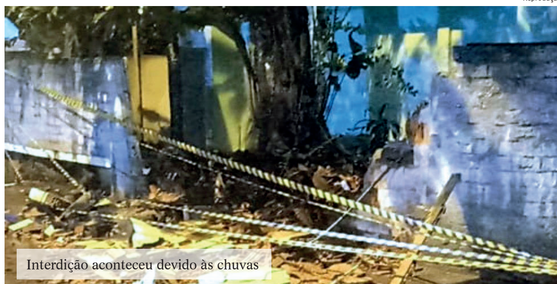
Interdição aconteceu devido às chuvas