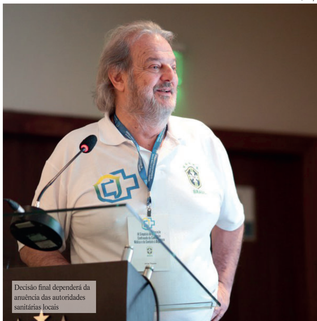
Decisão final dependerá da anuência das autoridades sanitárias locais

Percentual da população plenamente vacinada contra SARS-CoV-2