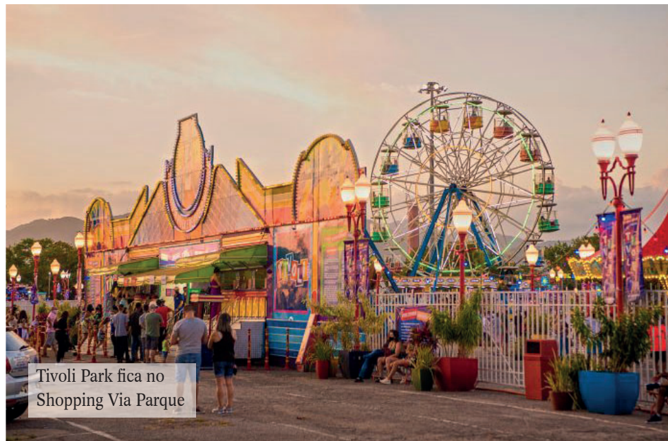
Tivoli Park fica no Shopping Via Parque

Tivoli Park Local: Av. Ayrton Senna, 3.000 – no estacionamento do Shopping Via Parque – Barra da Tijuca; Horário de funcionamento: segunda, quinta e sexta das 17h às 22h; sábado e feriados das 16h às 22h; e domingo das 11h às 21h.