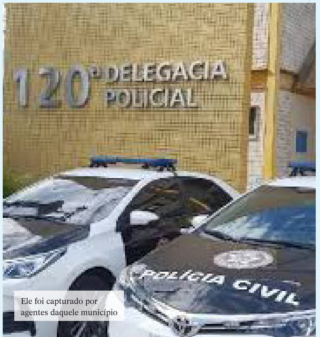
Ele foi capturado por agentes daquele município

Após a ação, ele foi encaminhado para o sistema penitenciário e está à disposição da Justiça.