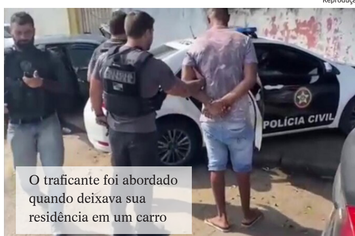
O traficante foi abordado quando deixava sua residência em um carro