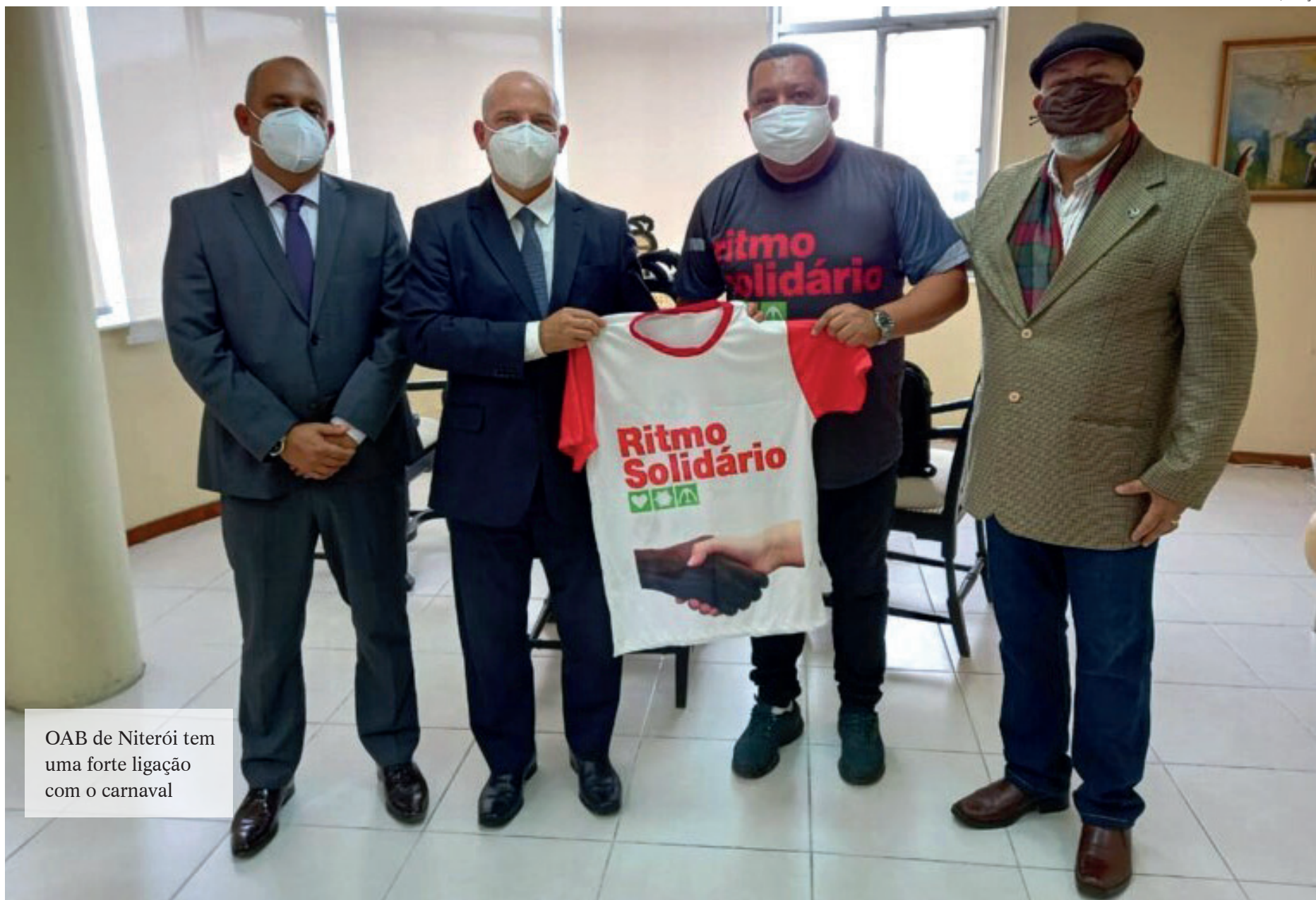
OAB de Niterói tem uma forte ligação com o carnaval

A OAB de Niterói, tem uma forte ligação com o carnaval, sendo a única sede do país a ter um bloco Carnavalesco formado por advogados.