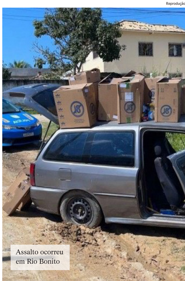
Assalto ocorreu em Rio Bonito