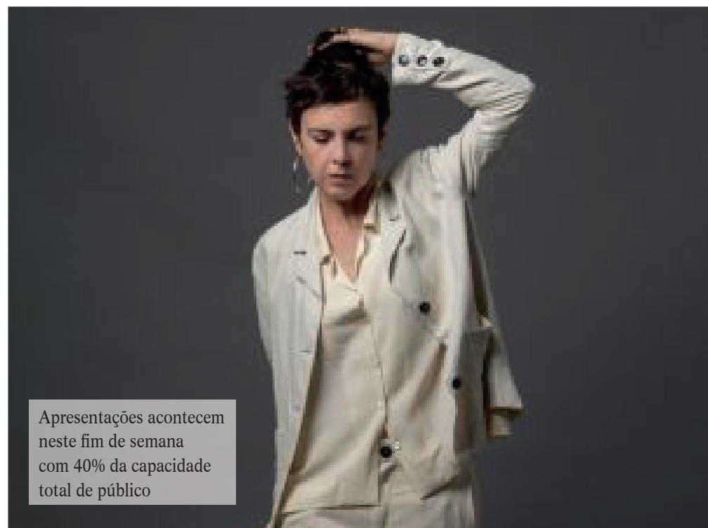
Apresentações acontecem neste fim de semana com 40% da capacidade total de público

Adriana Calcanhotto | Voz e Violão Local: Teatro Claro Rio – Rua Siqueira Campos, 143 – 2º piso – Copacabana Data: 20 (sexta) e 21 (sábado) de agosto Horário: 20h Ingressos: Entre R$ 50,00 e R$ 120,00 Vendas: https://bilieto.sympla.com.br/event/68327/d/103764 Capacidade: 263 lugares (capacidade em 40%) Classificação: 12 anos