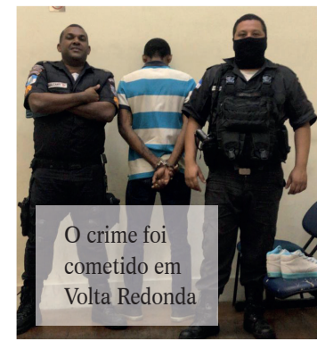
O crime foi cometido em Volta Redonda

O acusado foi detido e encaminhado para a 76ª DP (Centro), onde ele foi preso e o caso registrado.