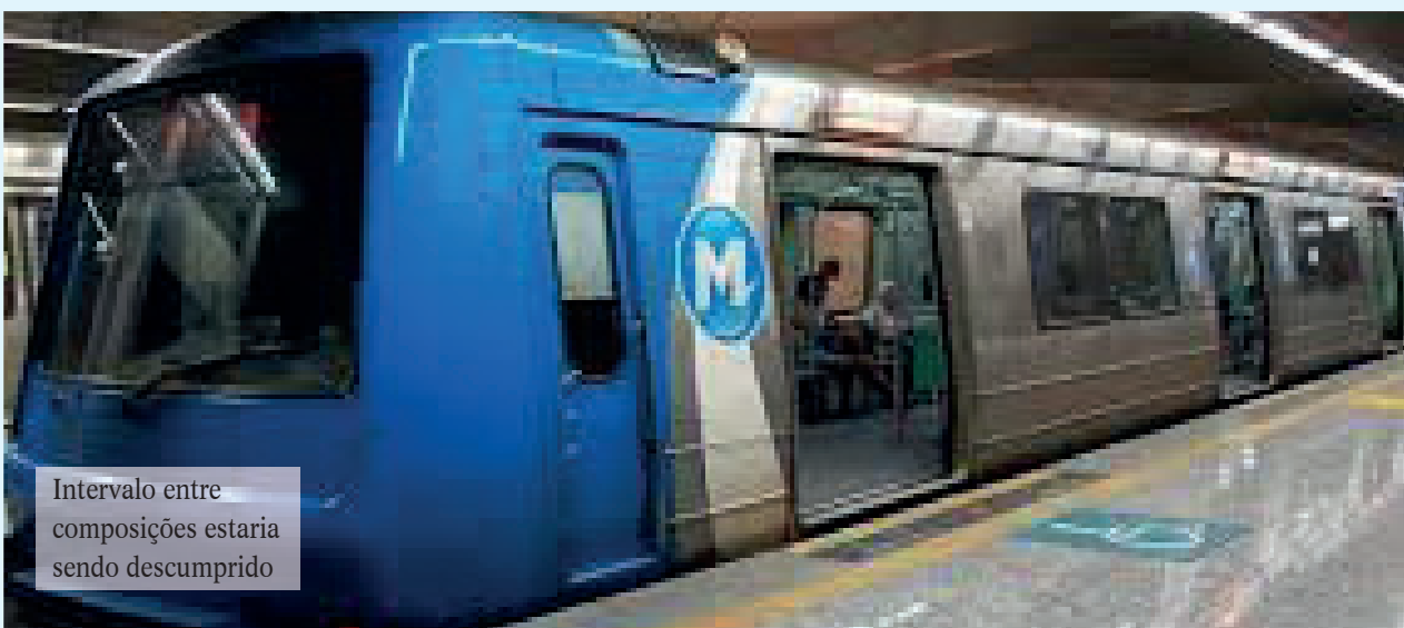
Intervalo entre composições estaria sendo descumprido

O Ministério Público do Estado do Rio de Janeiro (MPRJ), instaurou inquérito civil para apurar suposta má prestação do serviço por parte da concessionária Metrô Rio, que estaria descumprindo o intervalo previsto entre as composições.