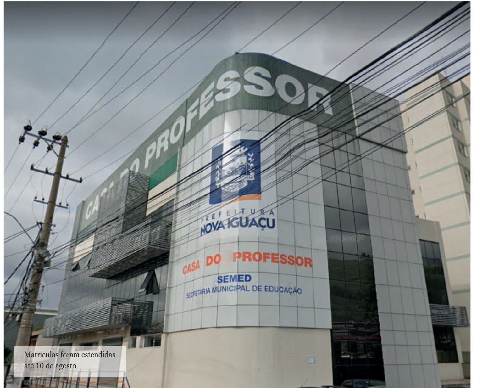
Matrículas foram estendidas até 10 de agosto

Vila de Cava – E.M. Professora Irene da Silva Oliveira Miguel Couto – E.M. Janir