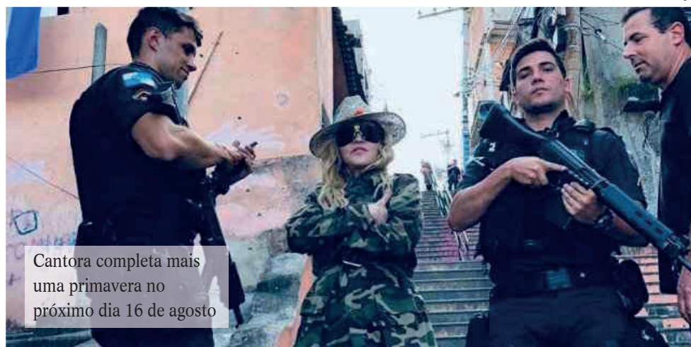
Cantora completa mais uma primavera no próximo dia 16 de agosto

Contudo, a funkeira Anitta, outro grande nome da música atual, pode ser a ponte entre a norte-americana e o Rio de Janeiro. Isso porque, segundo informou a revista Veja, Anitta é muito pró-