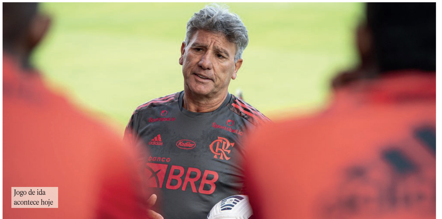
Jogo de ida acontece hoje

No domingo, a Conmebol publicou um protocolo de retorno de público aos estádios nos jogos da Libertadores e da Sul-americana. A recomendação é a de que apenas tenham acesso aos estádios aqueles que estão 100% imunizados com vacinas ou que apresentem exames PCR negativos feitos em até 48 horas antes da partida. Mulheres grávidas, pessoas com comorbidades e menores de 18 anos não poderão assistir aos jogos.