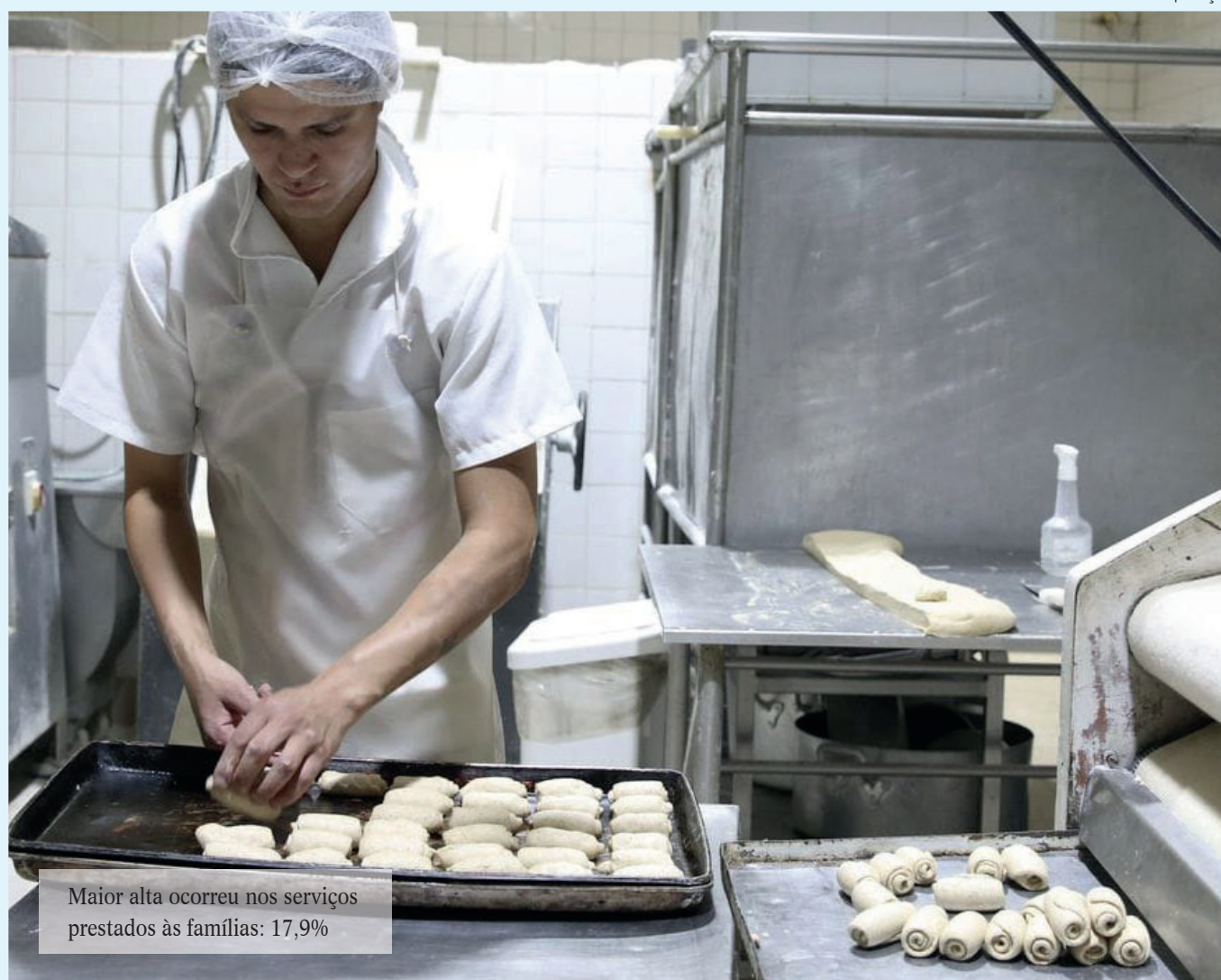
Maior alta ocorreu nos serviços prestados às famílias: 17,9%

A maior parte dos seus segmentos de atividades, ainda está 11,3% abaixo do recorde histórico de novembro de 2014. No ano, o setor acumula alta de 7,3% e, nos últimos 12 meses, queda de 2,2%. Os números fazem parte da Pesquisa Mensal de Serviços (PMS), divulgada hoje (13), no Rio de Janeiro, pelo Instituto Brasileiro de Geografia e Estatística (IBGE).