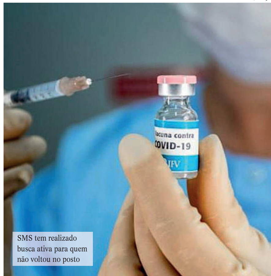
SMS tem realizado busca ativa para quem não voltou no posto

A Secretaria Municipal de Saúde (SMS) estima que cerca de 89 mil pessoas estão com a segunda dose da vacina contra a covid-19 atrasada no Rio. A imunização contra a doença causada pelo novo coronavírus só fica completa após a aplicação das duas doses.