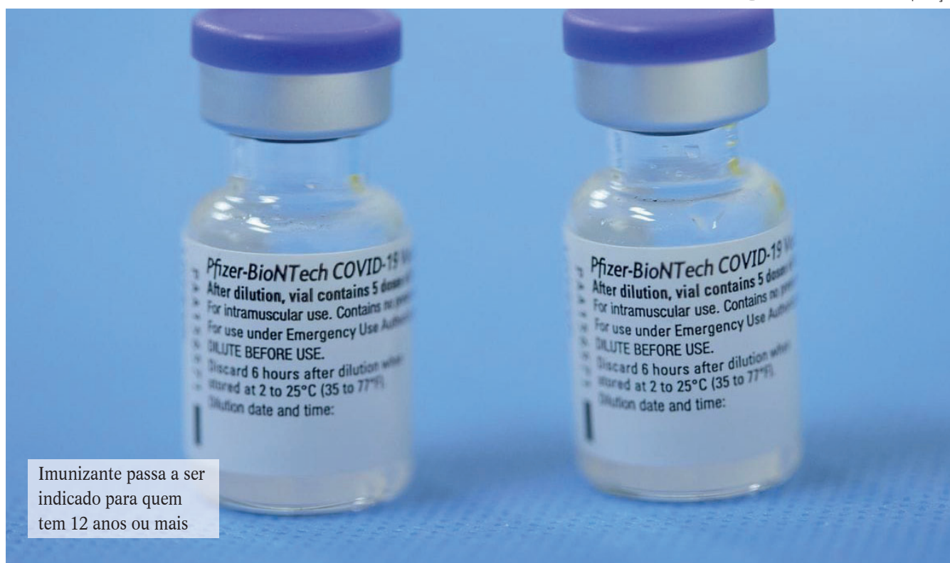
Imunizante passa a ser indicado para quem tem 12 anos ou mais

“A decisão sobre o registro e alterações no pós-registro de uma vacina ou medicamento é da área técnica. Para as vacinas em uso emergencial esta decisão é da diretoria colegiada”, explicou a Anvisa.