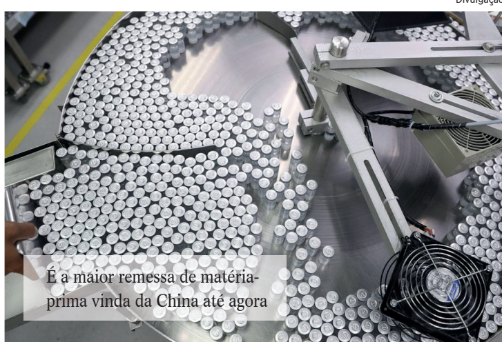
É a maior remessa de matéria-prima vinda da China até agora

O Instituto Butantan recebeu ontem uma remessa de 12 mil litros de ingrediente farmacêutico ativo (IFA) para produção de vacina CoronaVac contra covid-19. A remessa, a maior até agora de matéria-prima vinda da China, é suficiente para o envase de 20 milhões de doses do imunizante.