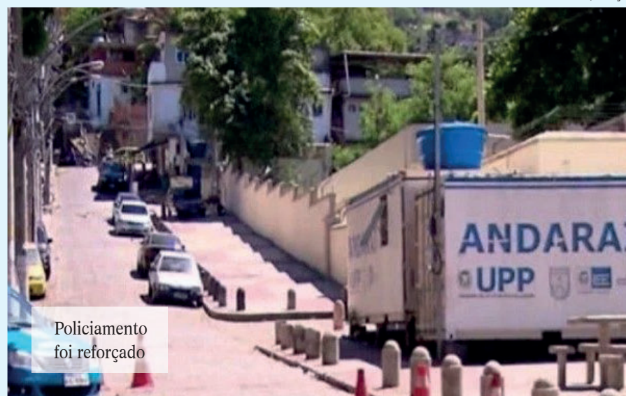
Policimento foi reforçado

A PM informou que equipes faziam patrulhamento na rua Adolfo Caminha, via que cruza a comunidade do Andaraí, quando foram atacados por criminosos armados. Houve confronto, mas sem registro de baleados. Ontem, equipes da Coordenadoria de Polícia Pacificadora (CPP) reforçam o policiamento na região.