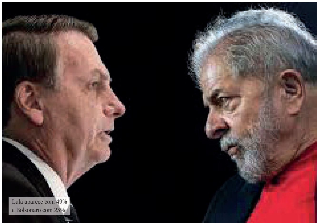
Lula aparece com 49% e Bolsonaro com 23%

Votaria com certeza ou poderia votar: 18% (era 15% em fevereiro)