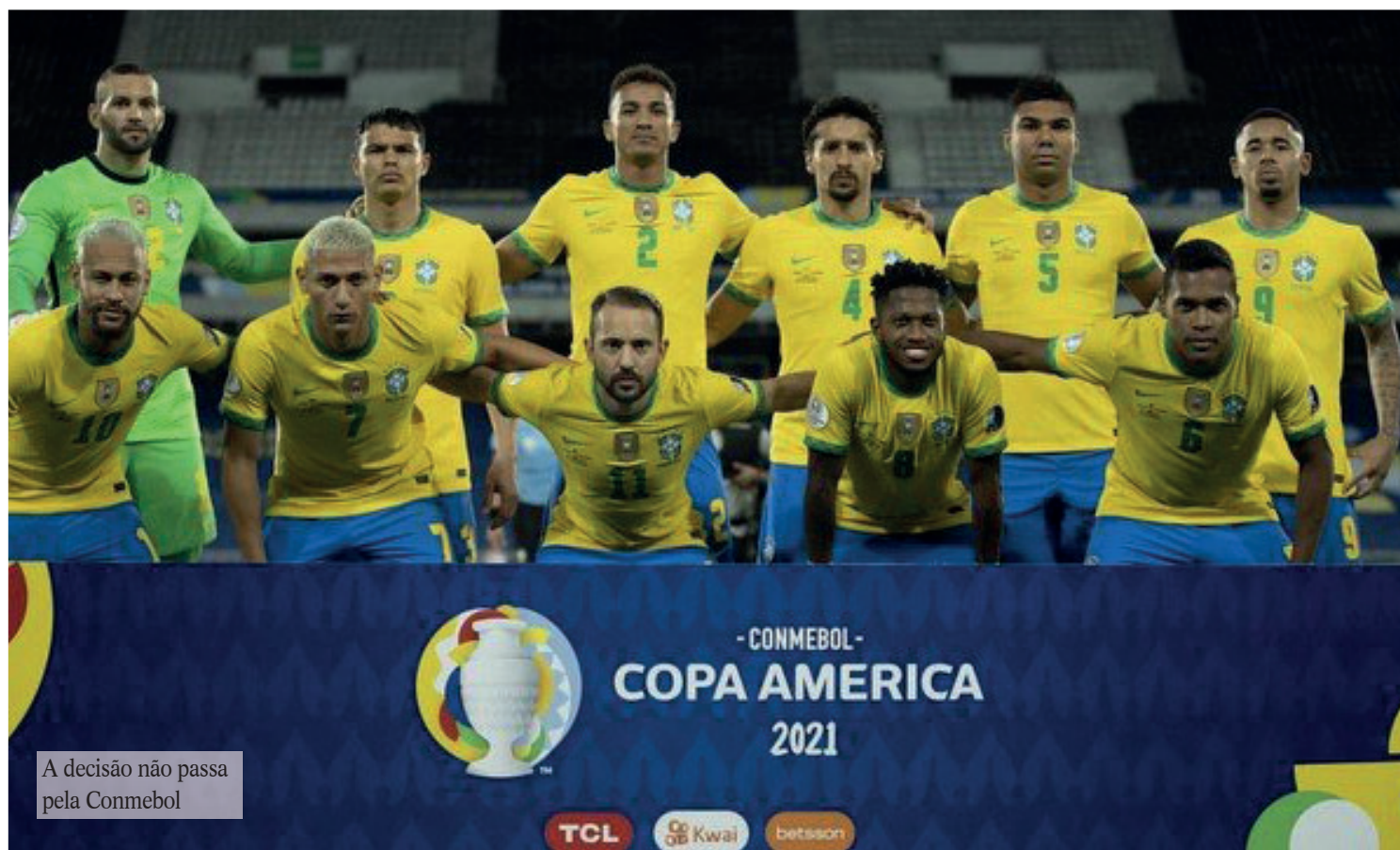
A decisão não passa pela Conmebol