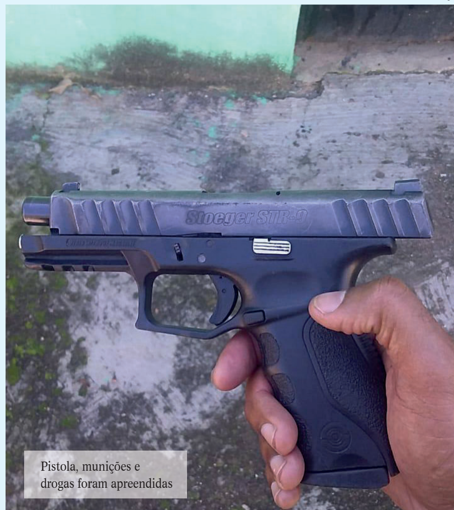
Pistola, munições e drogas foram apreendidas

Após a troca de tiros, os policiais fizeram buscas no local e encontraram um dos suspeitos caído ao solo. Ele foi socorrido e encaminhado ao Hospital Estadual Alberto Torres (Heat), no bairro Colubandê. Com o homem, os agentes apreenderam uma pistola, munições, 12 tabletes de maconha e 82 cápsulas de cocaína, que estavam em uma mochila. A ocorrência foi registrada na 73ª DP (Neves).