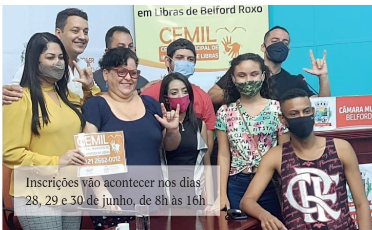
Inscrições vão acontecer nos dias 28, 29 e 30 de junho, de 8h às 16h

A Fundação de Desenvolvimento Social de Belford Roxo (Funbel) abrirá nos dias 28, 29 e 30 de junho, de 8h às 16h, as inscrições para a formação de turmas para o Curso Básico em Libras (Língua Brasileira de Sinais) promovido por sua Central Municipal de Intérpretes de Libras (Cemil). A duração é de três meses e estão sendo oferecidas 200 vagas.