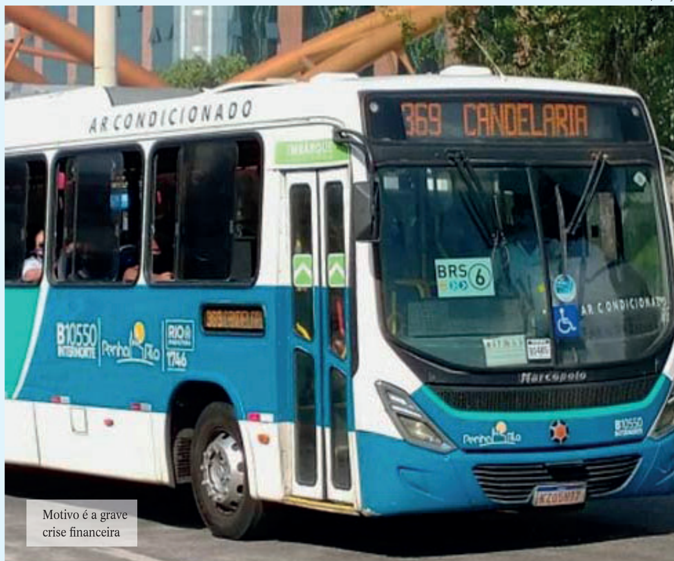
Motivo é a grave crise financeira