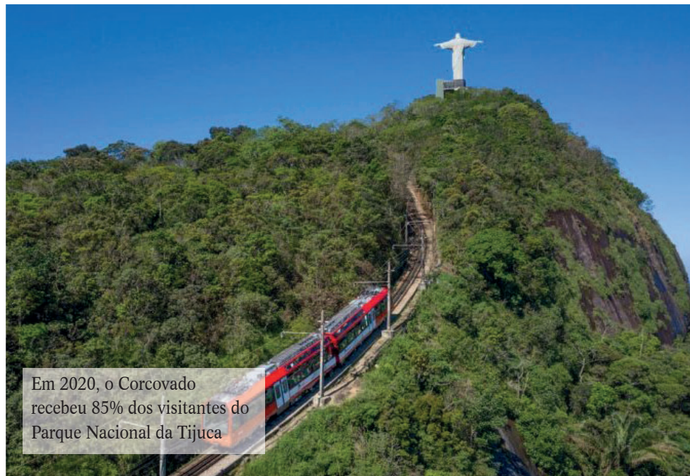
Em 2020, o Corcovado recebeu 85% dos visitantes do Parque Nacional da Tijuca

As informações disponíveis sobre 2020 fazem referência apenas aos meses de janeiro, fevereiro e março. Devido à pandemia, o Parque Nacional da Tijuca precisou interromper seu funcionamento. No entanto, os dados mostram que a tendência dos anos anteriores do Corcovado ser o setor mais visitado se manteve, tendo recebido mais de 500