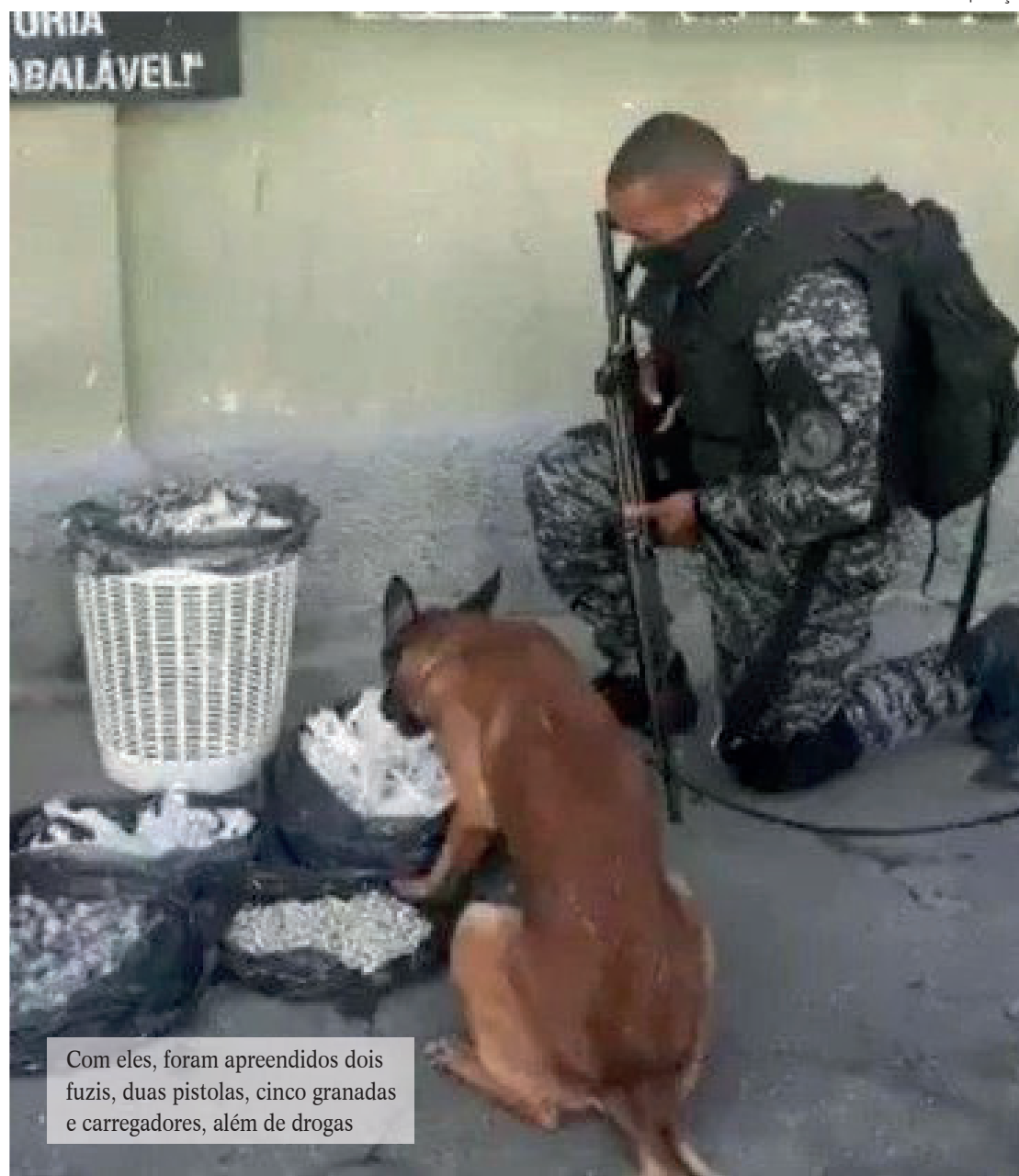
Com eles, foram apreendidos dois fuzis, duas pistolas, cinco granadas e carregadores, além de drogas

rói. O objetivo é intervir em uma intensa disputa territorial entre facções rivais. Em um outro ponto da comunidade, três homens foram presos e um adolescente foi apreendido por policiais do Batalhão de Operações Policiais Especiais (BOPE). Com eles, foram apreendidos dois fuzis 7.62, duas granadas, 16 carregadores, cartuchos e munições a serem contabilizados.