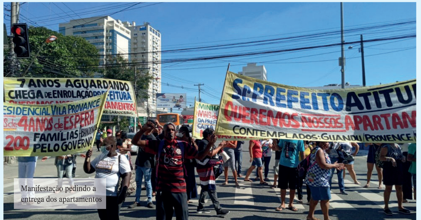
Manifestação pedindo a entrega dos apartamentos

Os beneficiários do programa habitacional Casa Verde e Amarela - antigo Minha Casa Minha Vida - em Nova Iguaçu, na Baixada Fluminense, realizaram uma manifestação na manhã da última quinta-feira (24) pedindo a entrega dos apartamentos que, segundo eles, já estão prontos para serem habitados.