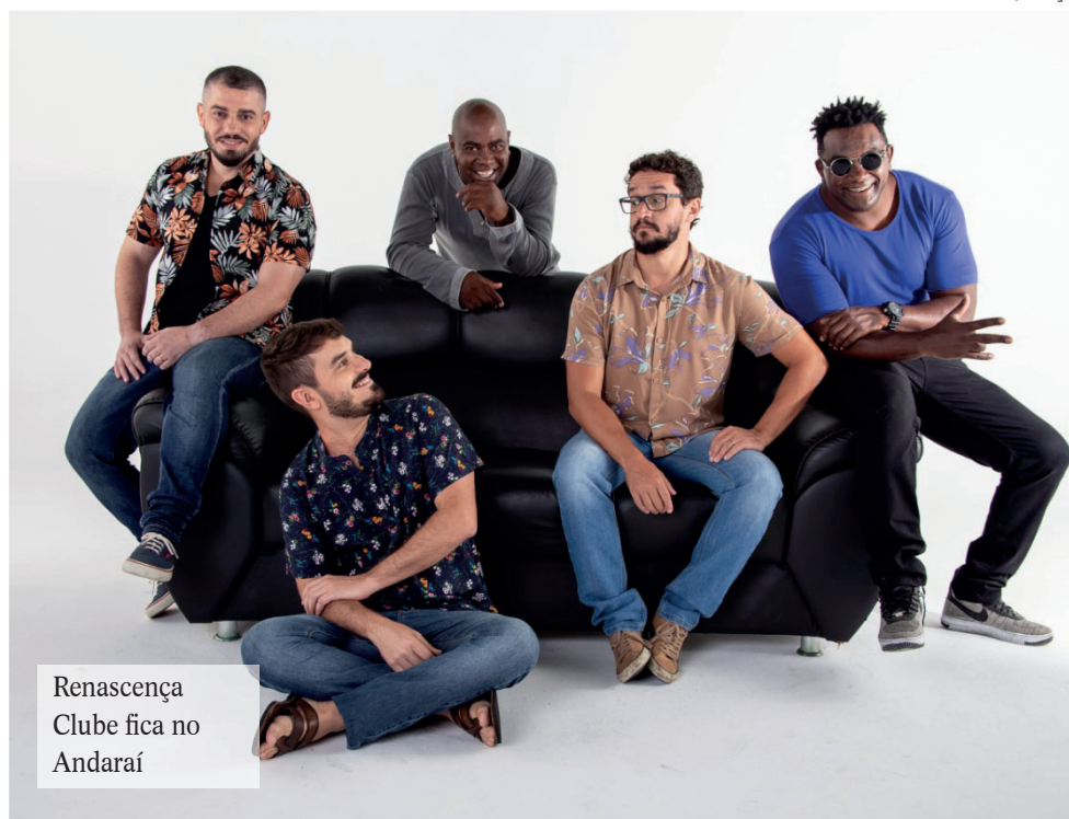
Renascença Clube fica no Andaraí

O Galocantô surgiu em meados do ano 2000 na Lapa. O despretenso encontro de toda quinta-feira passou a ser opção de samba e resistência frequentada por bambas. Com o passar do tempo o Galo foi se consolidando como grupo de samba e passou a se apresentar nas casas de show do Rio. Hoje, o Galo se apresenta em todo Brasil com canções que marcaram a sua carreira e que fazem parte dos três CDs e um DVD lançados pelo Grupo. No Renascença Clube eles vão misturar as músicas dos