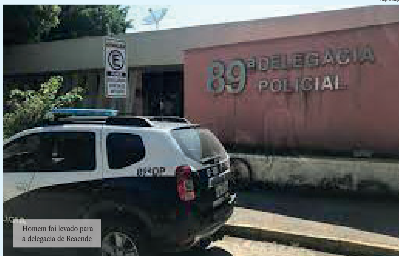
Homem foi levado para a delegacia de Resende