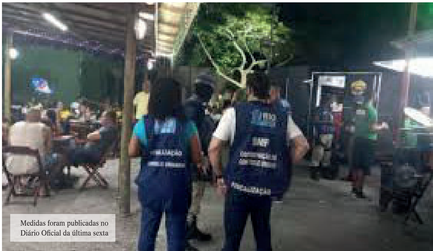
Medidas foram publicadas no Diário Oficial da última sexta

Espaços como shopping centers, centros comerciais e galerias de lojas; museus e bibliotecas; cinemas e teatros; casas de festas; salões de jogos; circos; áreas de recreação infantil e parques de diversões, temáticos e aquáticos; atrações turísticas; Aquário e jardim zoológico; apresentações, drive-in, feiras, congressos e exposições também tem regras específicas. Segundo o decreto, a lotação máxima para esses locais somente com público sentado, deve ser de 40% em locais fechados e 60% em locais abertos. Além disso, não podem se formar filas ou aglomerações.