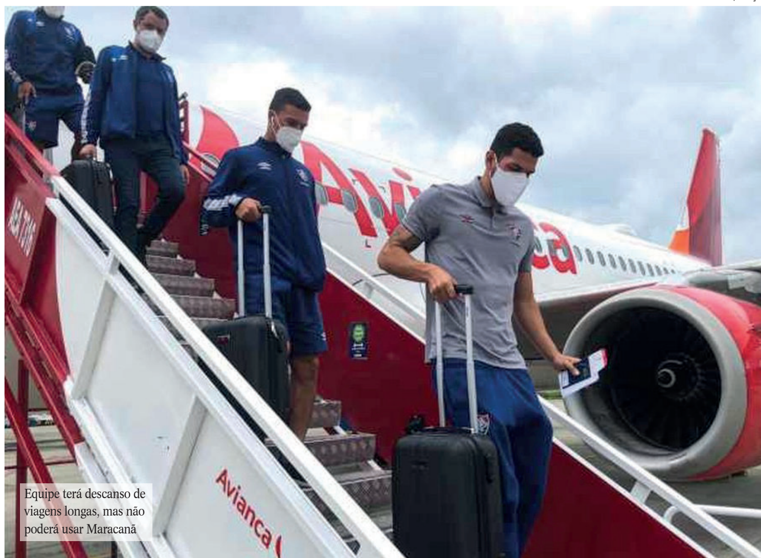
Equipe terá descanso de viagens longas, mas não poderá usar Maracanã

A próxima partida fora do Rio será contra o Sport, que ainda não tem data e horário definido, mas deve acontecer no final de semana no dia 10 de julho. Ou seja, o time terá mais de duas semanas sem longos deslocamentos. Três dias depois, porém, visita o Cerro Porteño, em Assunção, no Paraguai, pelas oitavas de final da Libertadores.