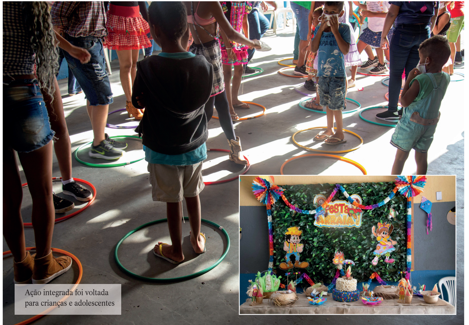
Ação integrada foi voltada para crianças e adolescentes

As atividades realizadas fazem parte do Serviço de Convivência e Fortalecimento de Vínculos. Através dele, o usuário tem acesso a diversas oficinas. Assim como este, o PAIF - Serviço de Proteção e Atendimento Integral à Família - também é um dos programas ofertados através da Proteção Social Básica e executados nos CRAS. Dessa forma, sua função é atuar de maneira preventiva no planejamento e na execução de ações para que as famílias não entrem em risco social, como casos de violência, tendo seus direitos violados.