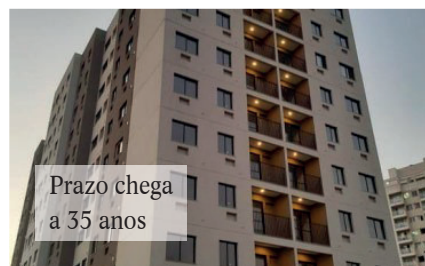
Prazo chega a 35 anos

Na modalidade “Poupança Caixa”, o prazo de pagamento é de até 35 anos, com juros a partir de Taxa Referencial (TR) mais 2,5% ao ano, somados à remuneração adicional da poupança. Além disso, o comprador pode optar por um prazo de carência de seis meses para início do pagamento da parcela de juros e amortização. No caso de imóveis novos, também disponíveis no feirão, as linhas de financiamento buscam