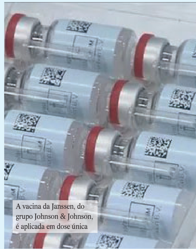
A vacina da Janssen, do grupo Johnson & Johnson, é aplicada em dose única

A doação das doses ao Brasil é a maior já feita pelo governo americano a qualquer país até agora. O principal assessor do presidente Joe Biden para a América Latina afirmou que a doação ao Brasil reflete “o foco dos EUA para combater a Covid numa das regiões mais afetadas pela pandemia”. A intenção da Casa Branca é compartilhar 55 milhões de vacinas em todo o mundo.