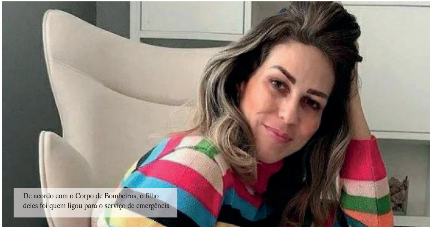
De acordo com o Corpo de Bombeiros, o filho deles foi quem ligou para o serviço de emergência

De acordo com o Corpo de Bombeiros, o filho deles foi quem ligou para o serviço de emergência. O garoto relatou uma discussão entre os pais e logo depois ouviu os disparos.