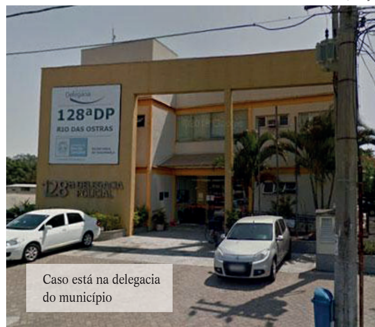
Caso está na delegacia do município

Na ocasião da ação conjunta, os policiais cumpriram mandados de prisão por homicídio e por roubo. Os três foram encaminhados ao sistema penitenciário, onde ficarão à disposição da Justiça.