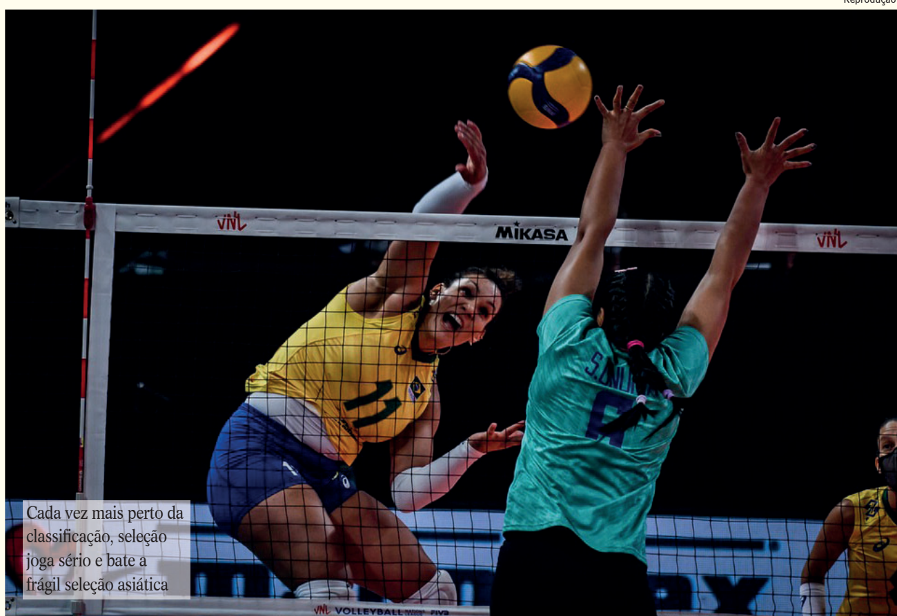
Cada vez mais perto da classificação, seleção joga sério e bate a frágil seleção asiática

O Brasil volta à quadra na próxima sexta-feira, contra a Coreia do Sul, às 10h. O SporTV2 transmite a partida ao vivo.