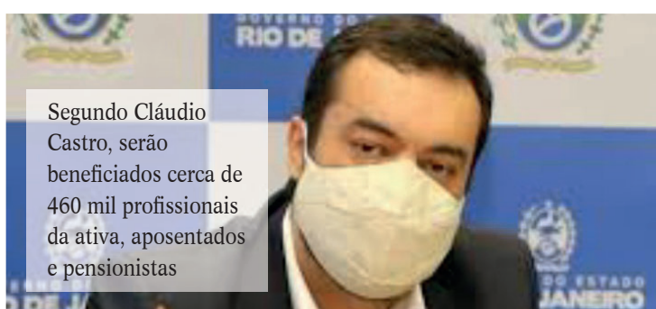
Segundo Cláudio Castro, serão beneficiados cerca de 460 mil profissionais da ativa, aposentados e pensionistas

O governo do Rio anunciou, ontem, que vai antecipar o pagamento do 13º salário dos servidores do estado para o dia 30 de junho. Segundo o governador Cláudio Castro, serão beneficiados cerca de 460 mil profissionais da ativa, aposentados e pensionistas.