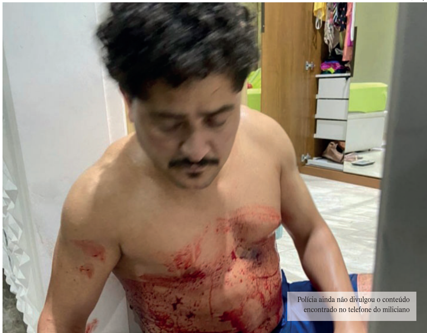
Polícia ainda não divulgou o conteúdo encontrado no telefone do miliciano

O telefone do miliciano foi apreendido, mas a polícia ainda não divulgou o conteúdo extraído do aparelho.