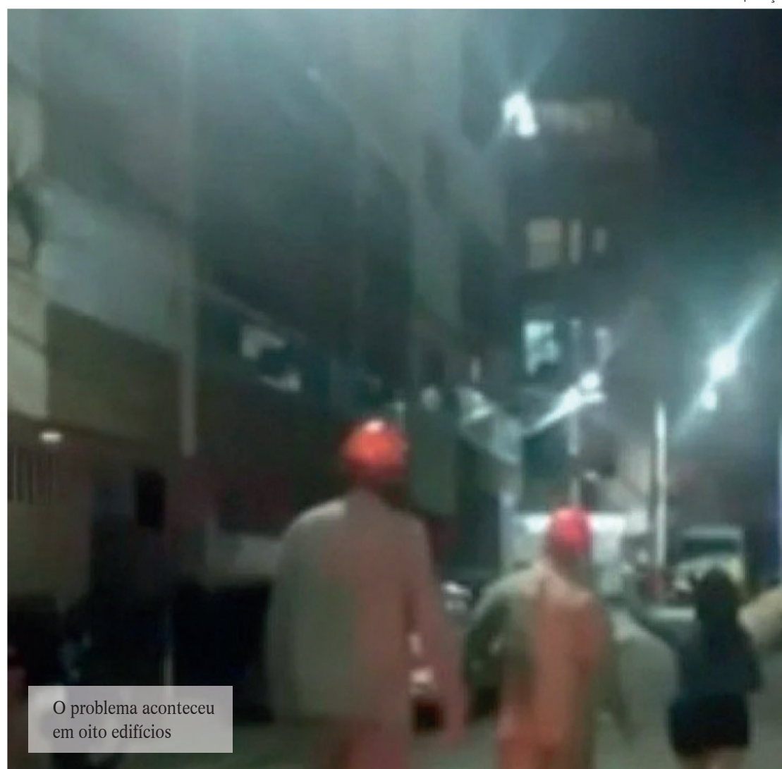
O problema aconteceu em oito edifícios

de Bombeiros, as primeiras ligações para a central de atendimento aconteceram por volta das 2h. O quartel da região foi acionado para o atendimento. A Defesa Civil também esteve no local e pediu para que todos deixassem os prédios. Segundo a Defesa Civil, cerca de 60 famílias moram nesses imóveis.