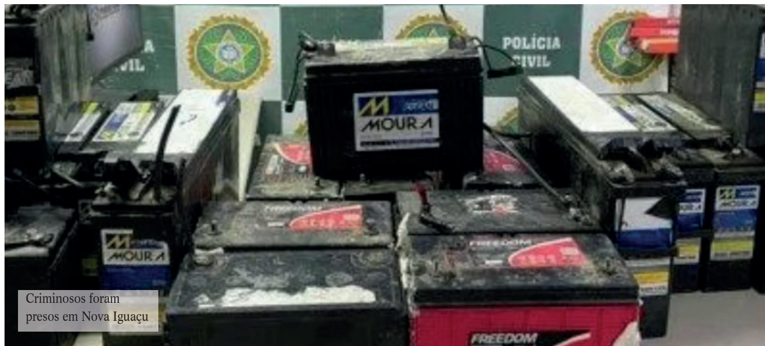
Criminosos foram presos em Nova Iguaçu

Assim que foi descoberto, o evento foi imediatamente interdito e os receptadores presos em flagrante. Todos foram encaminhados ao sistema penitenciário, onde estarão à disposição da Justiça.