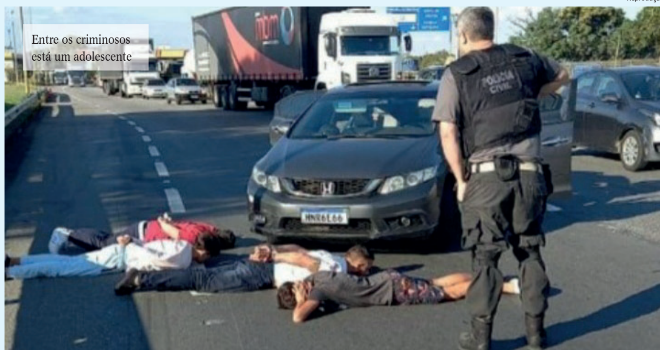
Entre os criminosos está um adolescente

Policiais da 14ª DP (Leblon) prenderam três homens e apreenderam um adolescente envolvidos em furtos de apartamentos em bairros da Zona Sul do Rio. Os criminosos foram surpreendidos retornando para São Paulo, onde residem, quando passavam pela Rodovia Presidente Dutra, na altura de Itatiaia. Eles estavam com chave de fenda e alicate de pressão, ferramentas usadas para arrombar as portas das residências, das quais eram levadas joias, relógios e dinheiro.