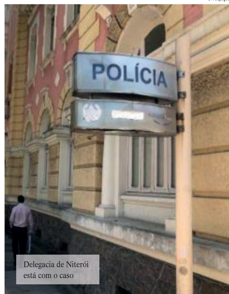
Delegacia de Niterói está com o caso

A Polícia Civil vai investigar um suposto caso de agressão ocorrido na madrugada do último domingo dentro de um motel em Niterói, na Região Metropolitana do Rio. Uma mulher, que teve nome e idade preservados, foi encontrada ensanguentada dentro de um quarto. Ela estava acompanhada do namorado.