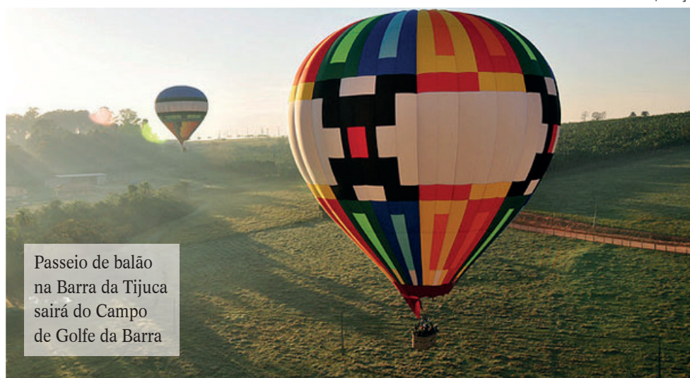
Passeio de balão na Barra da Tijuca sairá do Campo de Golfe da Barra

O ponto alto do voo cativo de balão é que, além de estar nas alturas é contar com a vista privilegiada do Golfe,