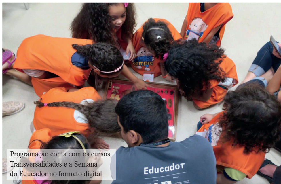
Programação conta com os cursos Transversalidades e a Semana do Educador no formato digital

O segundo acontece no dia 30 de junho, às 15h, com o tema A resiliência das estrelas: o céu como patrimônio histórico, cultural e natural da humanidade. Alan Alves-Brito, professor e mestre e doutor em ciências, aborda o céu diurno e o céu noturno em uma perspectiva museológica, de valor cultural, histórico e natural, em que variadas narrativas de povos distintos que passaram