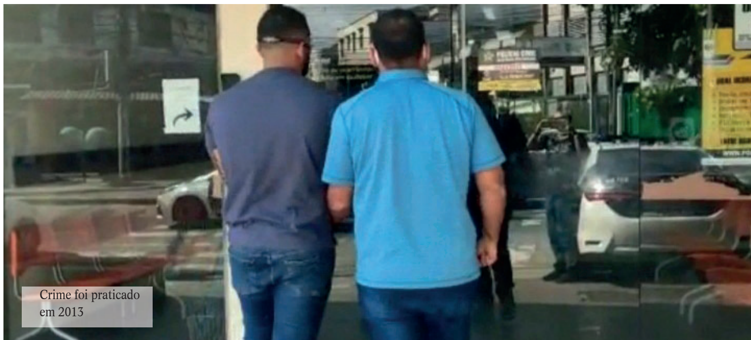
Crime foi praticado em 2013

Ele foi encaminhado ao sistema prisional e está à disposição da Justiça do Estado do Acre.