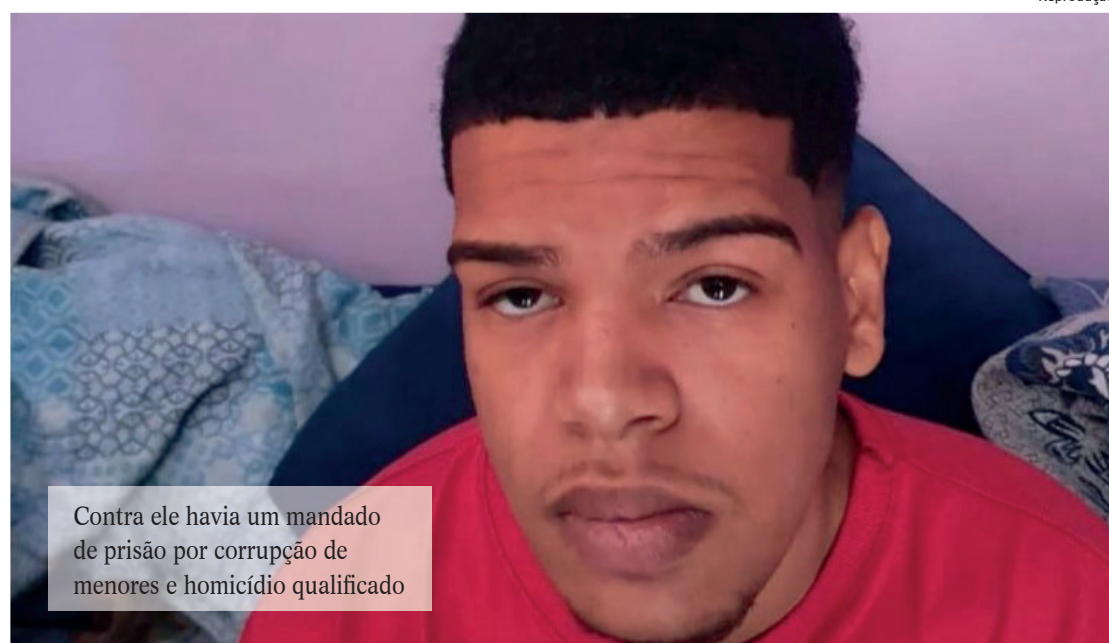
Contra ele havia um mandado de prisão por corrupção de menores e homicídio qualificado

O confronto teve início quando policiais que realizavam patrulhamento ostensivo no local, com o reforço do Grupamento de Intervenções Táticas (GIT) foram atacados por homens armados.