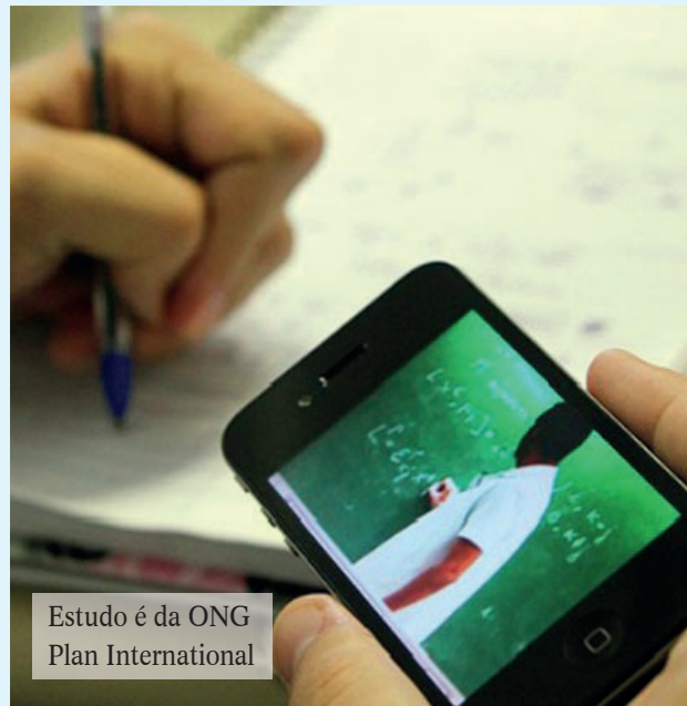
Estudo é da ONG Plan International

Nas entrevistas, as jovens relataram dificuldades de concentração e foco ao estudar em casa. Elas também citaram a falta de dinheiro para planos de dados, telefones celulares e outros custos relacionados ao aprendizado online, além do fato de não