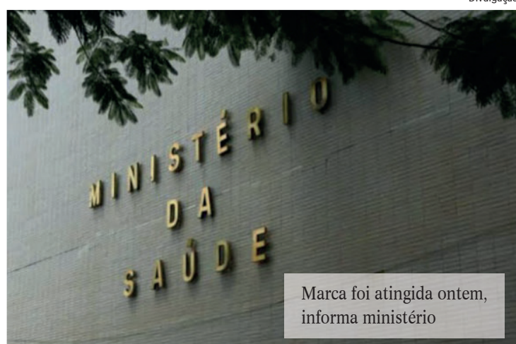
Marca foi atingida ontem, informa ministério

O Brasil atingiu ontem a marca de 90 milhões de doses de vacinas contra a covid-19 distribuídas no país, informou o Ministério da Saúde em mensagem no Twitter.