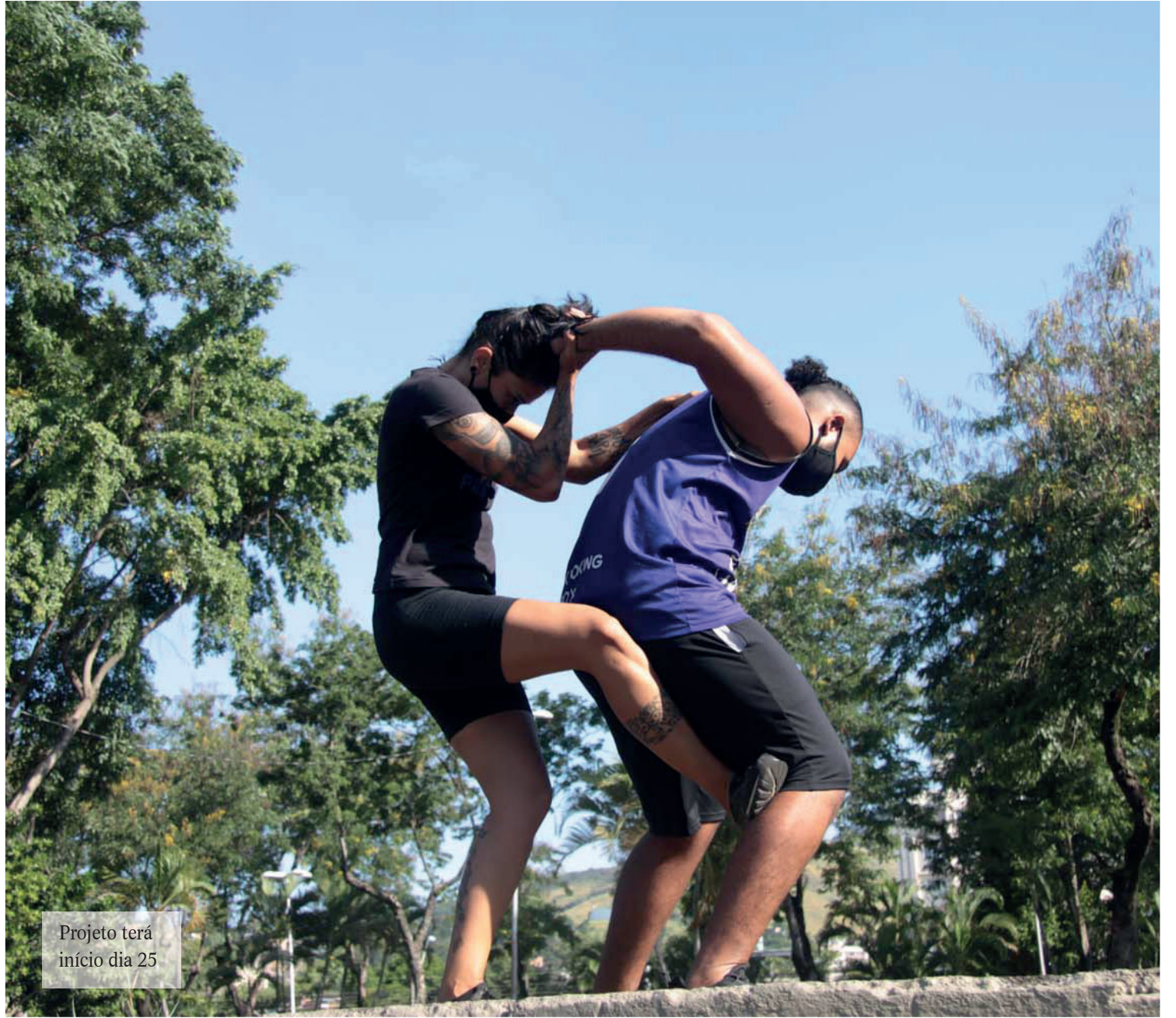
Projeto terá início dia 25

Por conta da pandemia, a SEMAS abrirá somente 15 vagas por núcleo, para que seja possível cumprir com as regras de ouro que evitam a disseminação da Covid-19. Futuramente, o projeto-piloto deverá ser levado para todos os CRAS da cidade e ter 40 alunas em cada um dos núcleos. As inscrições para a oficina podem ser feitas diretamente nos núcleos já confirmados. Para isso, basta que as mulheres estejam inseridas no Cadastro Único. Caso contrário, o cadastramento poderá ser feito no ato da matrícula.