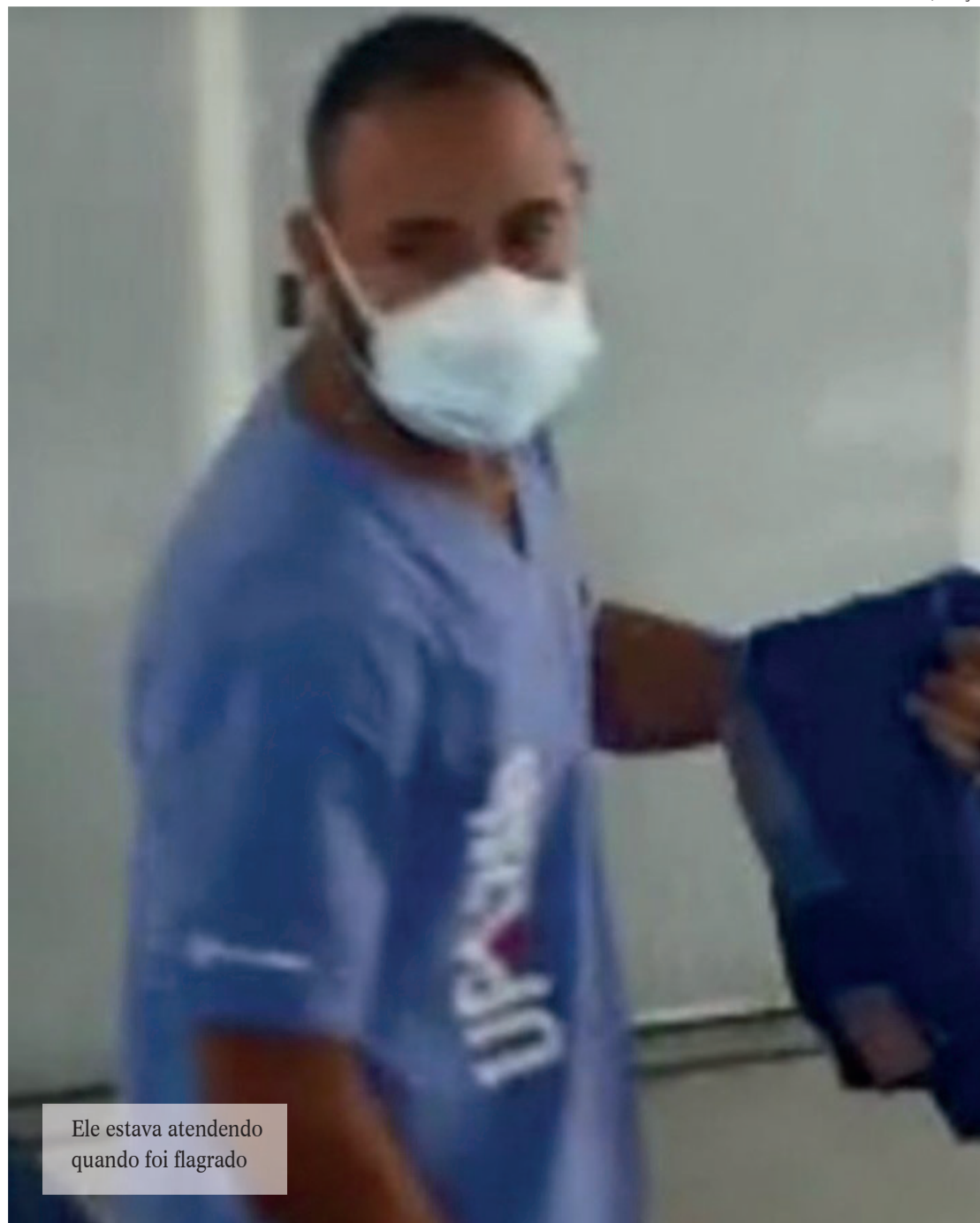
Ele estava atendendo quando foi flagrado

Itamberg deve responder pelos crimes de tentativa de estelionato, falsidade ideológica e exercício ilegal da profissão da medicina.