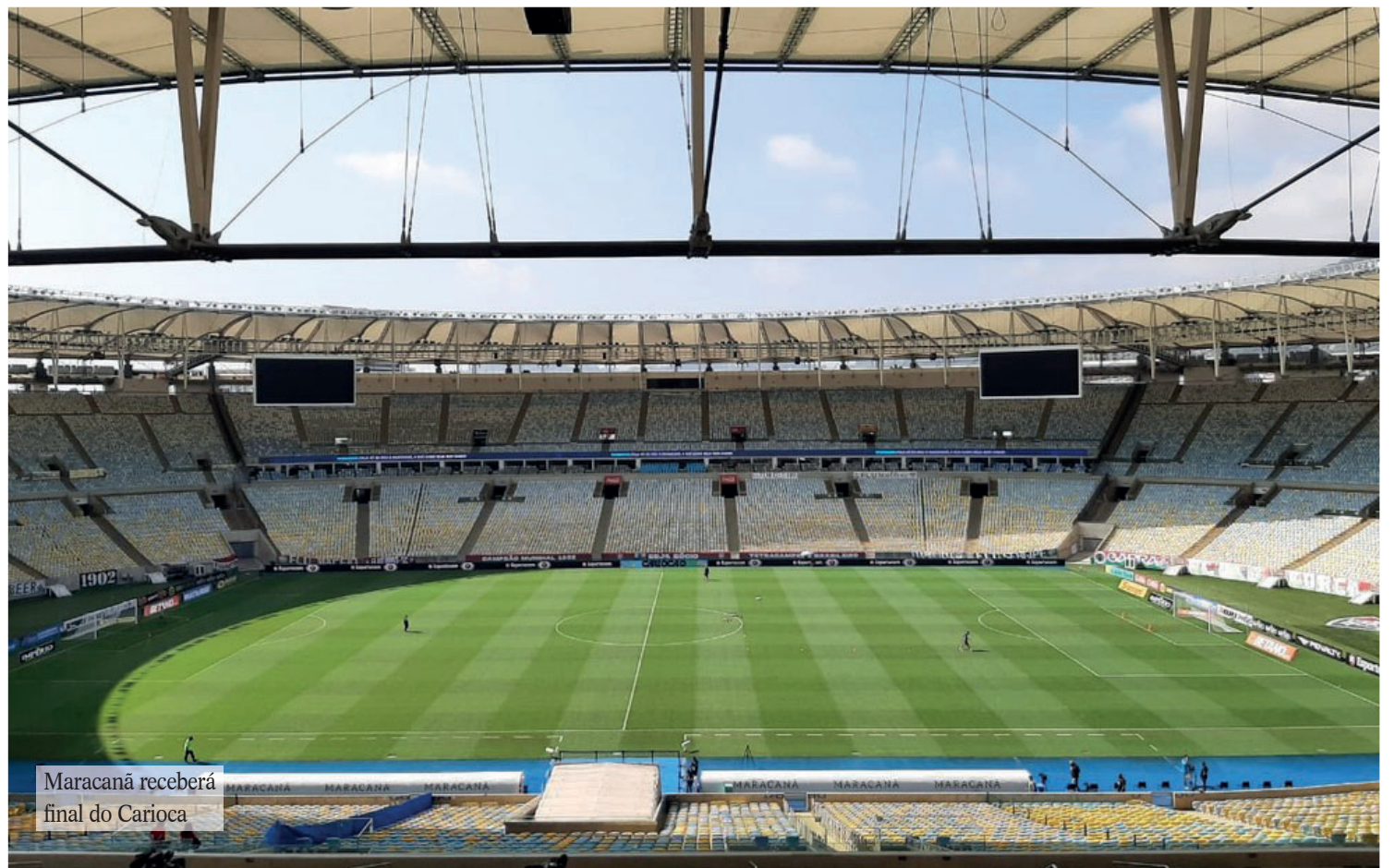
Maracanã receberá final do Carioca

O governador do Distrito Federal, Ibaneis Rocha, chegou a confirmar o interesse de receber a partida. Mas, ontem, afirmou que o gramado do estádio Mané Garrincha não teria condições de receber a final do Carioca.