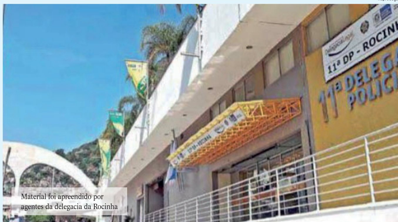
Material foi apreendido por agentes da delegacia da Rocinha

Policiais civis da 11ª DP (Rocinha) descobriram, na última segunda-feira, duas estufas que cultivavam maconha e seria distribuída na comunidade da Rocinha. Na casa, localizada em Nova Iguaçu, na Baixada Fluminense, os agentes também apreenderam grande quantidade da droga, que tem grande poder aluci-