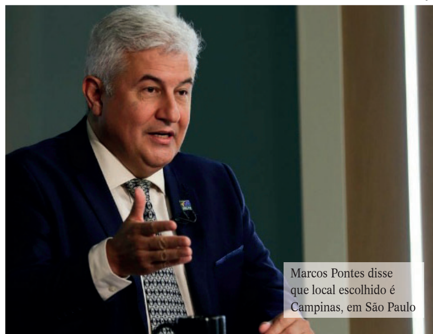
Marcos Pontes disse que local escolhido é Campinas, em São Paulo

O ministro da Ciência, Tecnologia e Inovação (MCTI), Marcos Pontes, defendeu a construção de um laboratório de biossegurança máxima (nível 4) no Brasil. De acordo com ele, o local escolhido para a instalação será o Centro Nacional de Pesquisas em Energia e Materiais (CNPEM), em Campinas, no interior do estado de São Paulo.