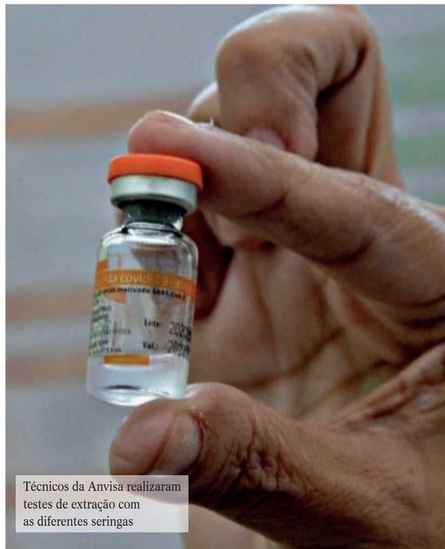
Técnicos da Anvisa realizaram testes de extração com as diferentes seringas

corretas. Técnicos da Anvisa realizaram testes de extração com as diferentes seringas, e também realizaram inspeção no setor de envase da Coronavac, no Instituto Butantan. Foi constatado que cada frasco tem entre 5,5ml e 5,9ml, equivalente a 10 doses, número considerado correto, já somada a margem de segurança.