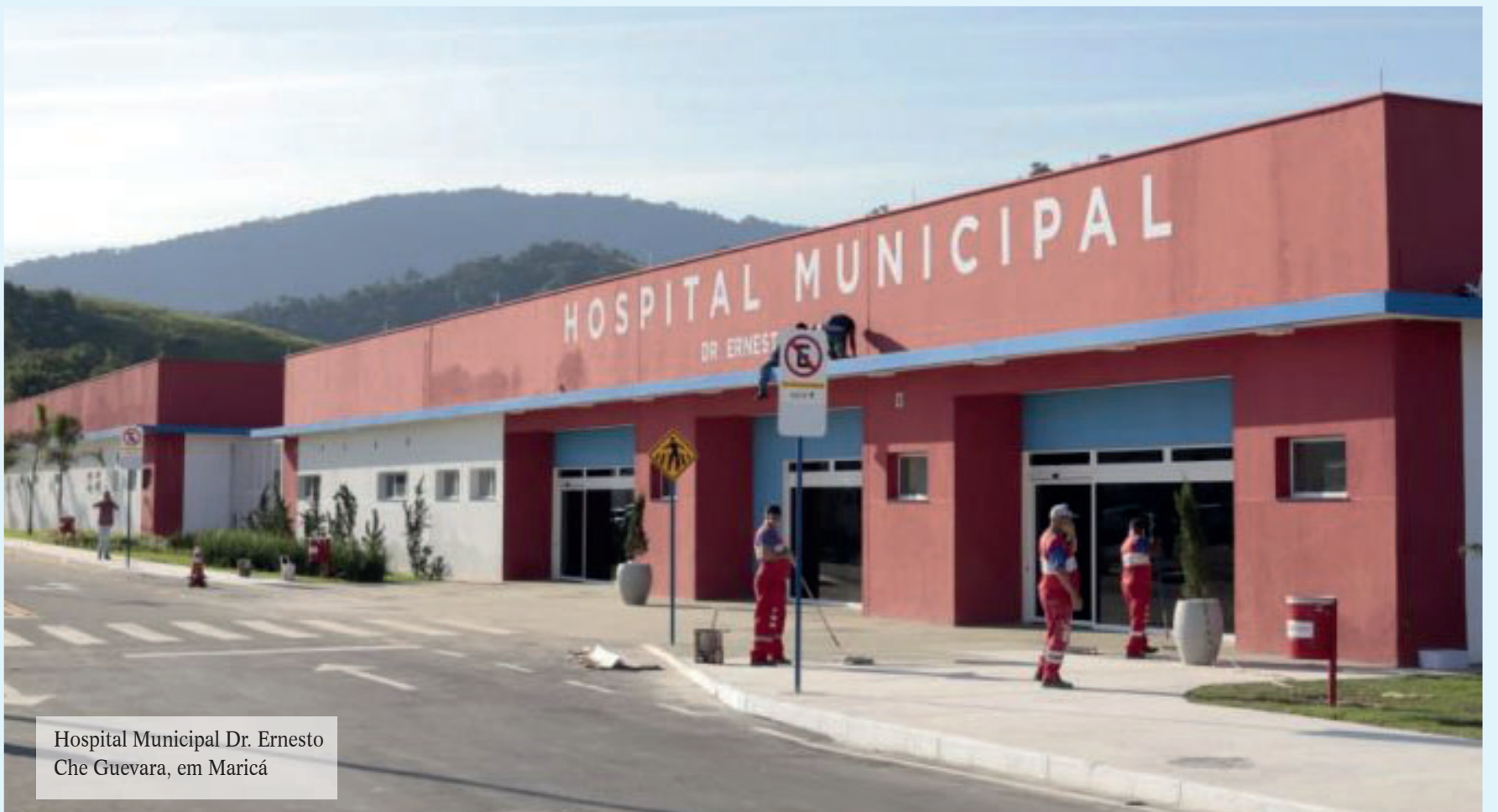
Hospital Municipal Dr. Ernesto Che Guevara, em Maricá

A Associação Saúde em Movimento informou, ainda, que um novo edital será disponibilizado no site da Organização Social em breve.