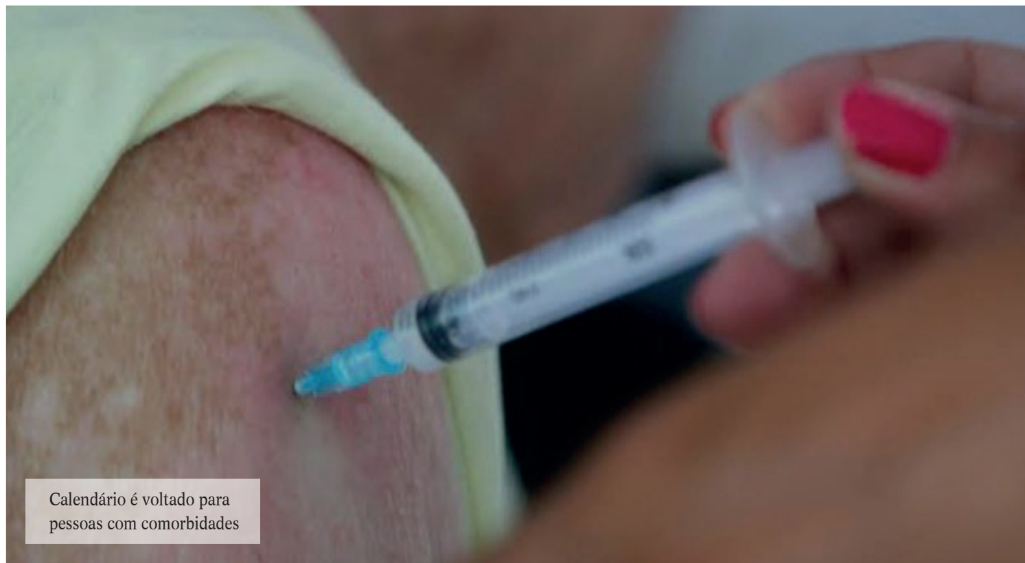
Calendário é voltado para pessoas com comorbidades

Para tomarem a vacina devem apresentar laudo médico detalhado justificando a recomendação e avaliação da relação risco-bene-